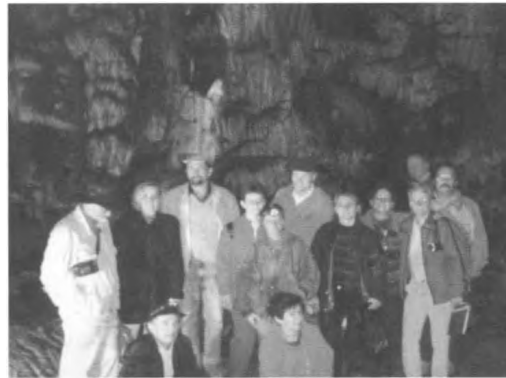
A résztvevők egy csoportja a Baradla-barlang hosszútúráján

A konferencia keretében a résztvevők művészi alkotásokra ihlető helyeket és régi feliratokat kerestek fel a Baradla-barlangban, zenés irodalmi műsorral egybekötött látogatást tettek Vörös-tótól Jósvafőig, valamint meglátogatták a Dobsinai-jégbarlangot és a Domica-barlangot.