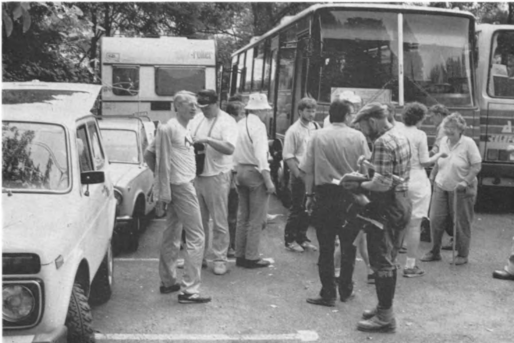
A D 1 kirándulás résztvevői

Fentiek ellenére megállapíthatjuk, hogy a kirándulás informatív lebonyolítása és élménygazdasága lehetővé tette, hogy a résztvevők megfelelő