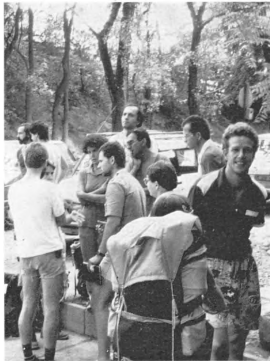
Indulás a budai barlangtúrákra

A vendégek színvonalas kalauzolását nagyban elősegítette, hogy a vezetők legnagyobb része megfelelő idegen nyelvismerettel rendelkezett. A túrák vezetésében az Acheron és a Bekey csoportok végeztek kimagasló munkát, valamint a túrákon közreműködtek az Anteus, Kinizsi, MÁFI és Papp Ferenc csoport tagjai is.