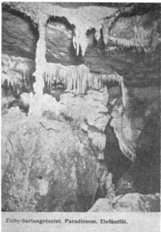
Zichy-barlangrészlet. Paradicsom. Elefántfűl.