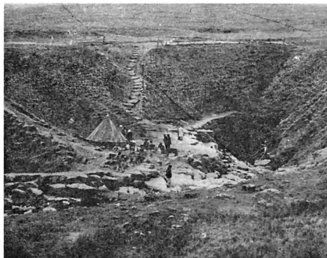
A Gaping Gill-barlang bejárata