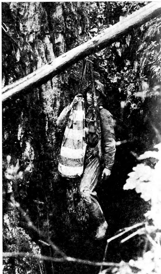
Ereszkedés a Vecsebükki-zsombolyba