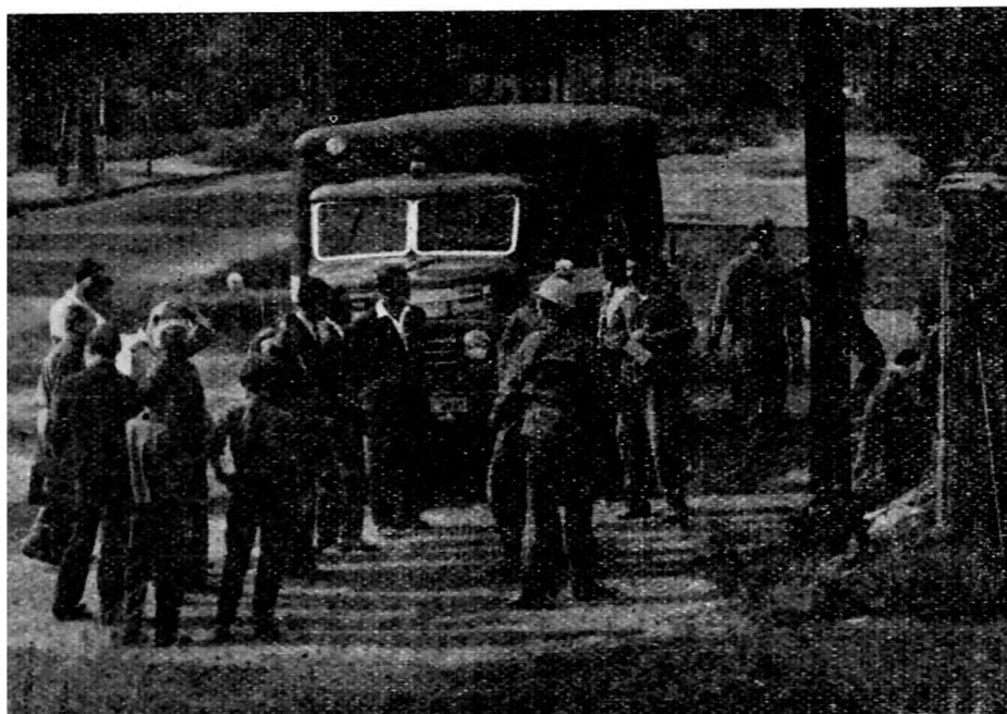
Rendőrségi riadóautó szállítja a mentőszolgálat tagjait a helyszínre. (A felvétel a Ferenc-hegyi-barlang bejárata előtt készült 1967. aug. 22-én)

Taródi Péter barlangi mentőszolgálatosoknak.