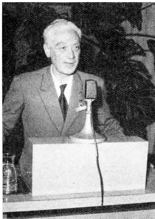
Bernard Gèze, az UIS elnöke székfoglaló beszédét tartja

Határozatot hozott a plénum az 1969-ben megrendezésre kerülő V. Nemzetközi Szeleológiai Kongresszus ügyében is. Miután ennek megrendezési jogát egyedül a Német Szövetségi Köztársaság barlangkutatói kérték, a kongresszus így vita nélkül bízta meg őket a rendezéssel. A következő kongresszus színhelye előreláthatólag Stuttgart lesz.