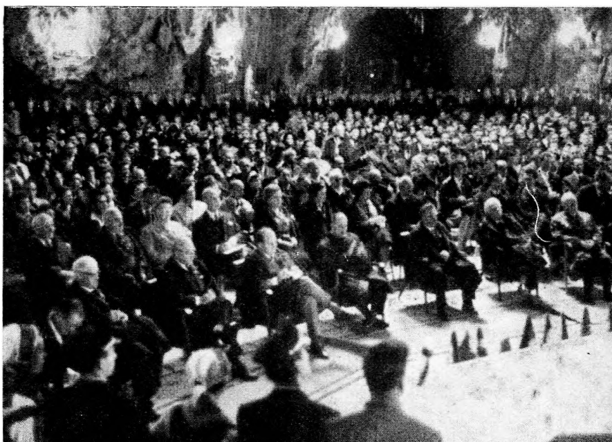
A kongresszus megnyitó ünnepsége a Postojnai-barlang Kongresszusi- (Bál-)termében

Szept. 11-én, a kongresszus hivatalos megnyitása előtti este a Postojnai-barlang, illetve a postojnai Barlangtani Kutató Intézet igazgatósága baráti