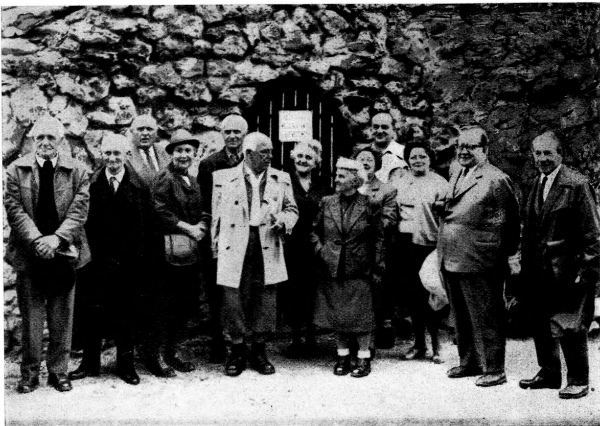
A Pálvölgyi-barlang veterán kutatói a barlang ünnepélyes újramegnyitásán

Nemcsak a környék rendezése folyamatos, de a barlangban is megindult a tervszerű kutatás. A Vass Imre kutatóház mintájára megkezdtek a sorozatos tudományos megfigyeléseket is. Eddig 4 helyen 496 alkalommal végeztünk csepegésmérést. Remény van rá, hogy a jövőben ezeket a méréseket távjelző műszerek beállításával több helyen és főleg pontosabban végezhetjük.