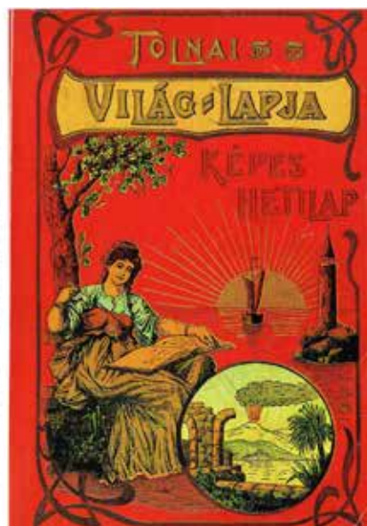
Tolnai Világlapja 1901–1944 , vál., bev. RAPCSÁNYI László, Budapest, IPV, [1988], borító

1920–1921 fordulóján az akkori fotóéletet közvetlenül vagy közvetve befolyásoló két tényezőt célszerű kiemelni. Az egyik a vesztes világháború, a forradalmak és Trianon folytán bekövetkezett gazdasági/társadalmi összeomlás.