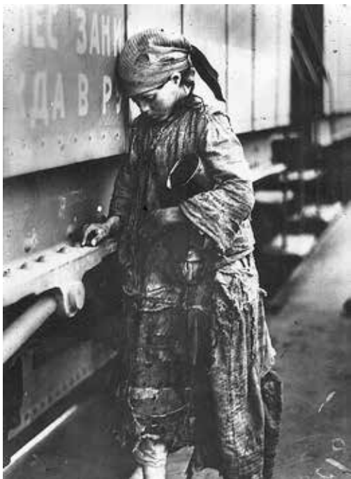
Ennivalóra várakozó kislány a segílyt hozó vonathál a Volga-vidéki éhínség idején, 1921.

Nyilvánvalóan lélektani okok miatt különösen a gyermekeket sújtó problémák ragadták meg a fotográfusok érdeklődését ekkortájt Bécstől Szovjet-Oroszországig. A magyar fényképek a maguk sajátos motívumaikkal kapcsolódtak ehhez a képáradathoz.