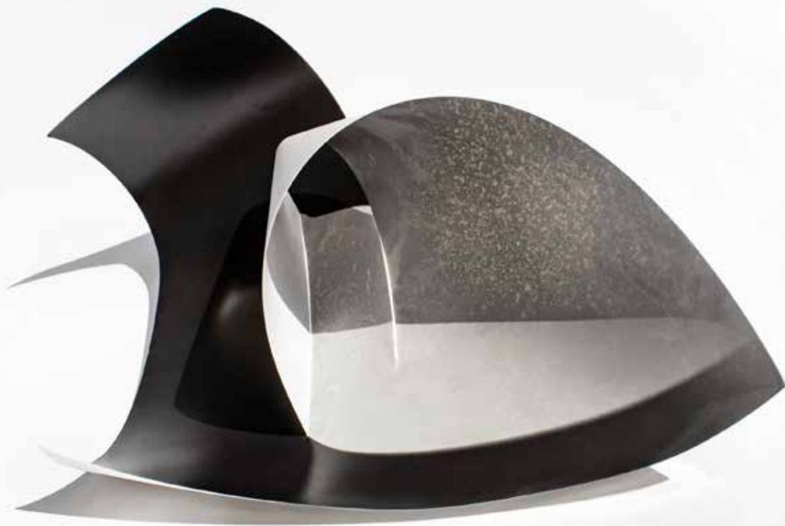
Gábor Enikő: Introverziók B8 , 2020, fotogram, hajlítható változat, 75x100cm