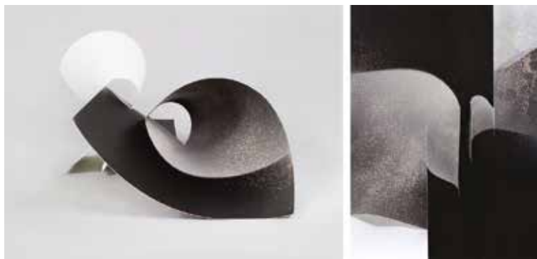
Gábor Enikő: Introverziók , 2020, hajlítható és kiterített változat, kemogram, 30x40 cm