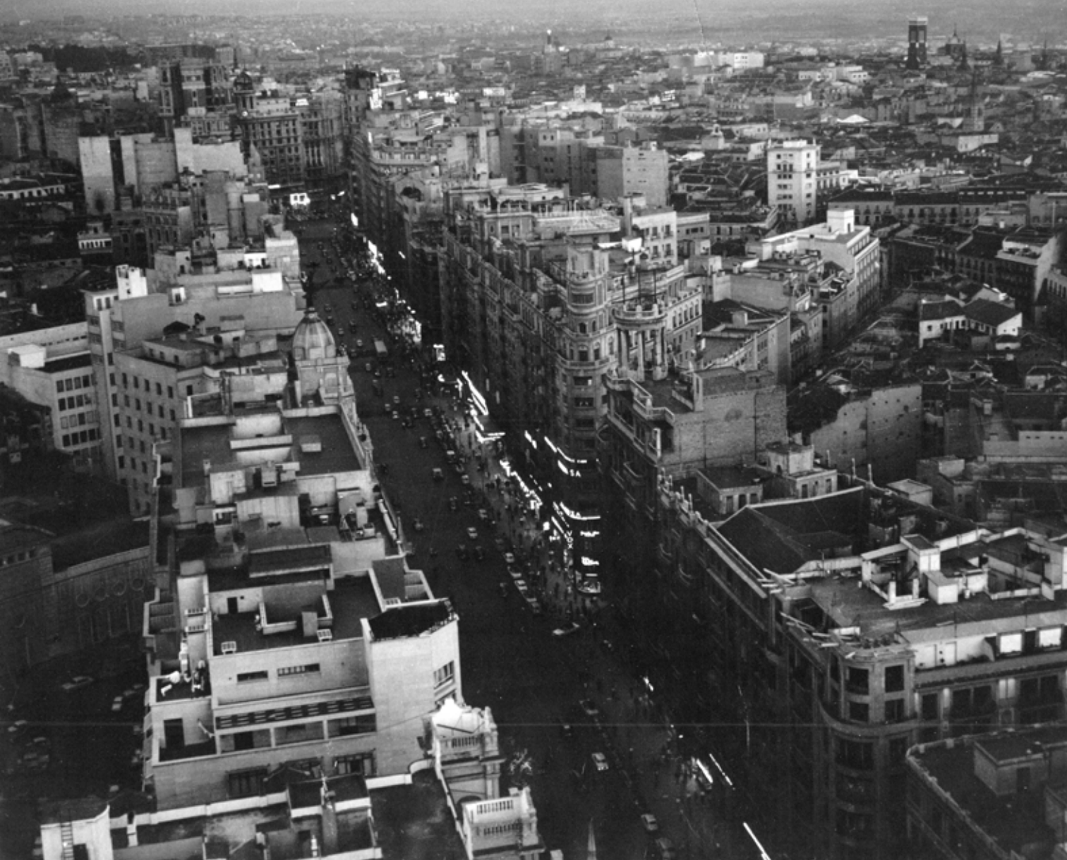
Madridi utcakép. Juan Gyenes felvétele. 1962 körül. Rómer Flóris Művészeti és Történeti Múzeum, Győr