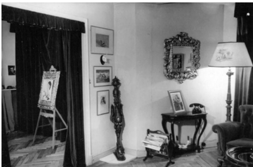
Juan Gyenes fotóműterme Madridban 1956 körül, (12 de la calle de Isabel la Católica, Madrid), Römer Flóris Művészeti és Történelmi Múzeum, Győr