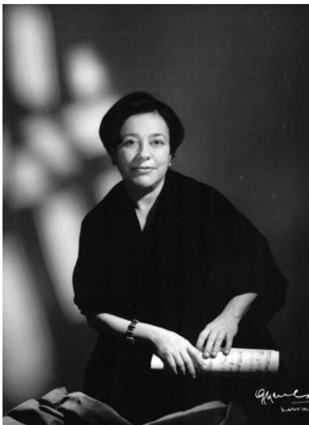
Alicia de Larrocha zongoraművésznő portréja. Juan Gyenes felvétele. 1966 körül. Rómer Flóris Művészeti és Történeti Múzeum, Győr