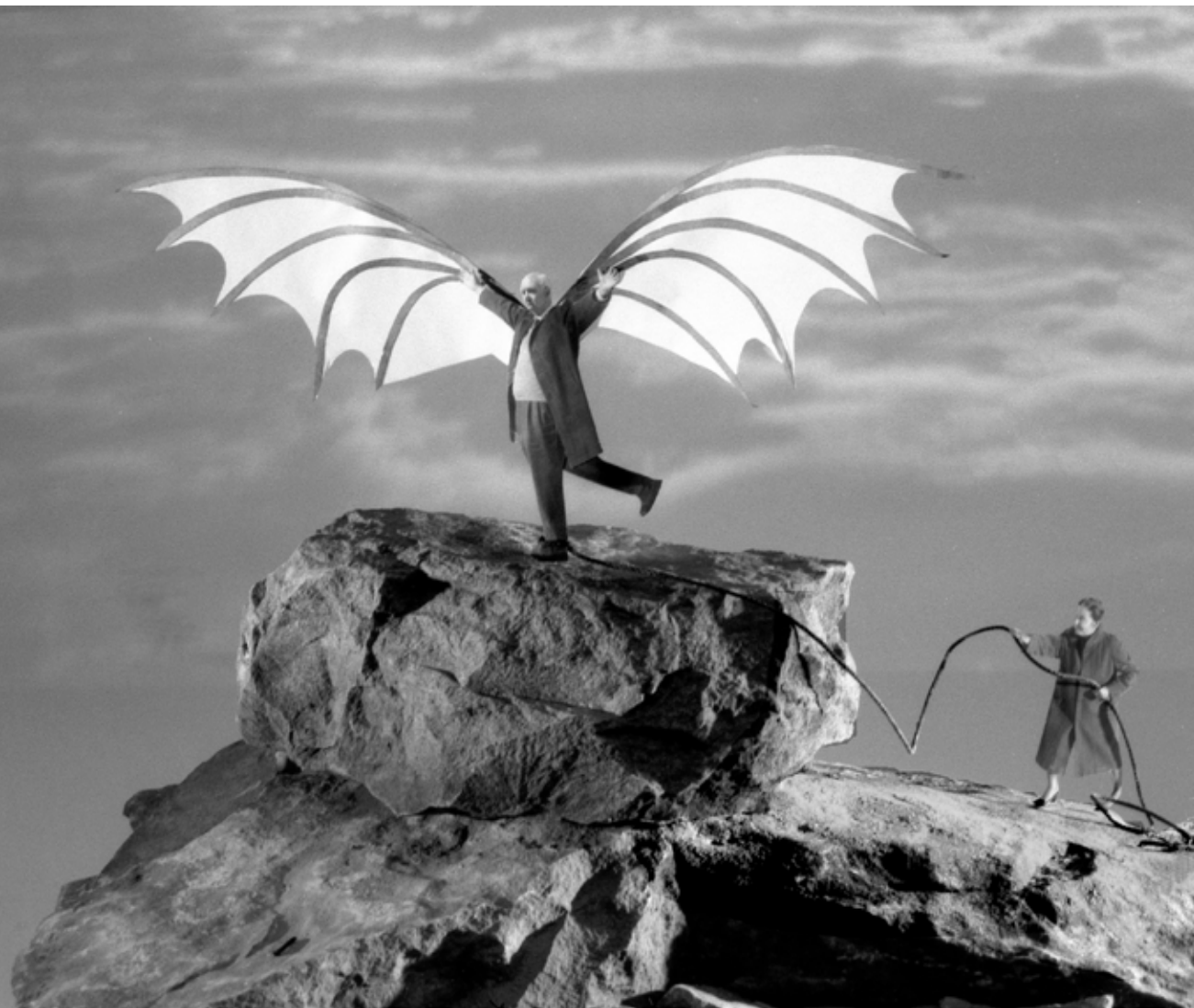
Gilbert Garcin: The flight of Icarus (after Leonardo da Vinci), silver gelatin print

A fekete-fehér fényképezés már magában is a színesben megélt világ absztrakciója, és nagy teret enged a nézőnek a saját értelmezéshez. „Mr. Everybody” így válik kortalanná és semleges neművé, akivel nőként vagy gyerekként is könnyen azonosulhatunk.