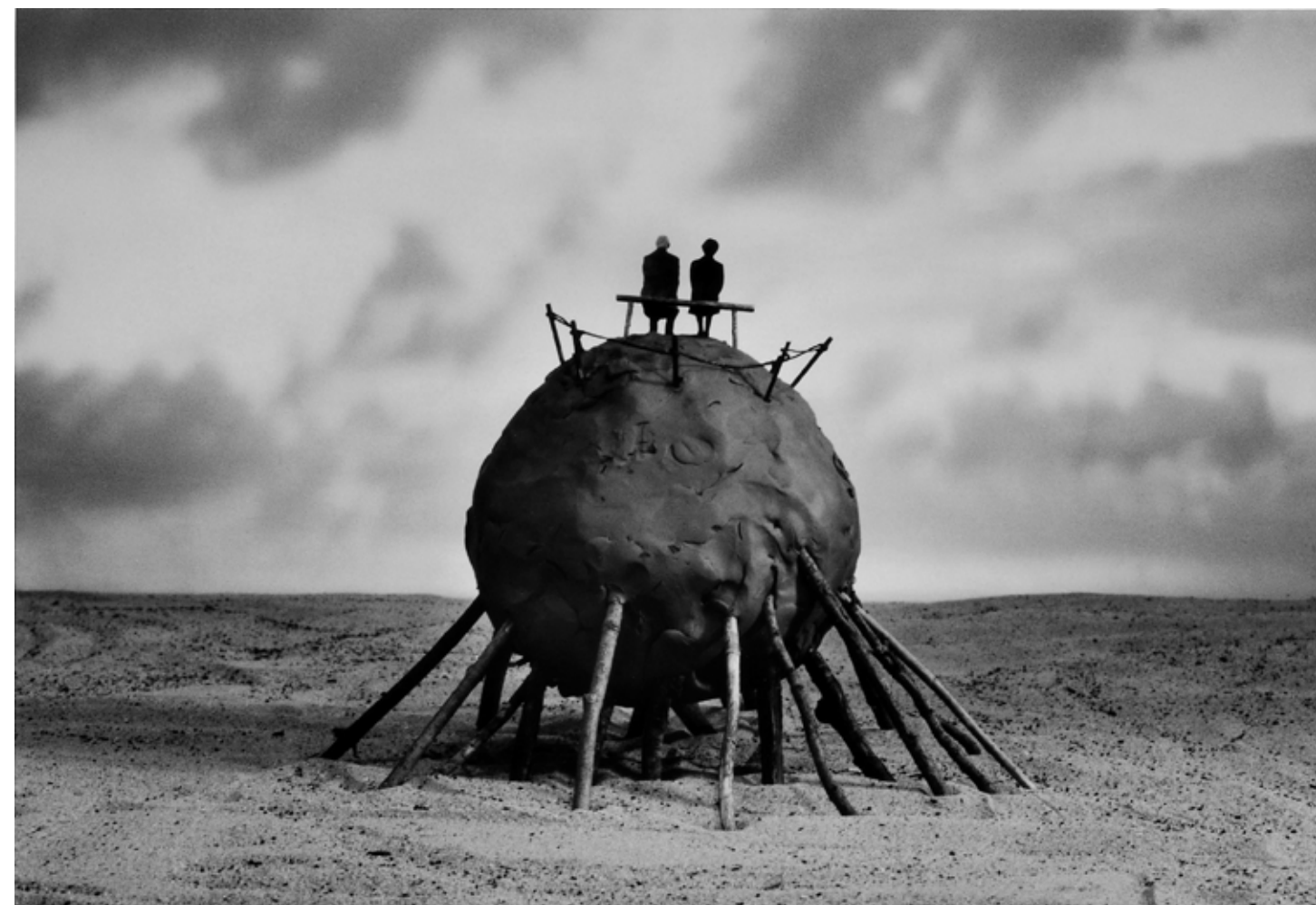
Gilbert Garcin: Ivory tower , silver gelatin print

Mégsem nevezné magát szurrealistának. „A képeimnek van valami abszurd jellege, ami a szurrealizmusra is jellemző. De csak az abszurditás fogalmára való hivatkozás az, amely kapcsolatot jelent a szurrealizmussal. [...] Inkább azonosulok vámos Rousseau-val, 8 mint a szurrealistákkal!” 9 Ebből is látható, hogy Garcin jól kiismeri magát a művészet történetében, és nem tekinthető tapasztalatlan és naiv művésznek. Épp ellenkezőleg, nagyon is tisztában van saját helyével, csak talán túl szerény. Legfontosabb témája az emberi létezés mikéntje ( Conditio Humana ), és így szabad teret enged a társadalomtörténeti utalásoknak, az áldozat és a bűnösség kérdésének. Sok mindent látott fényben villódzni, de látta az élet árnyékos oldalát is. Gilbert Garcin egyike a képcsináló filozófusoknak, akikre épp ma oly nagy szükségünk van.