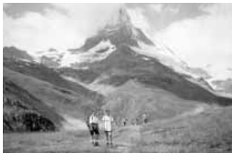
Svájci Alpok: a Matterhorn