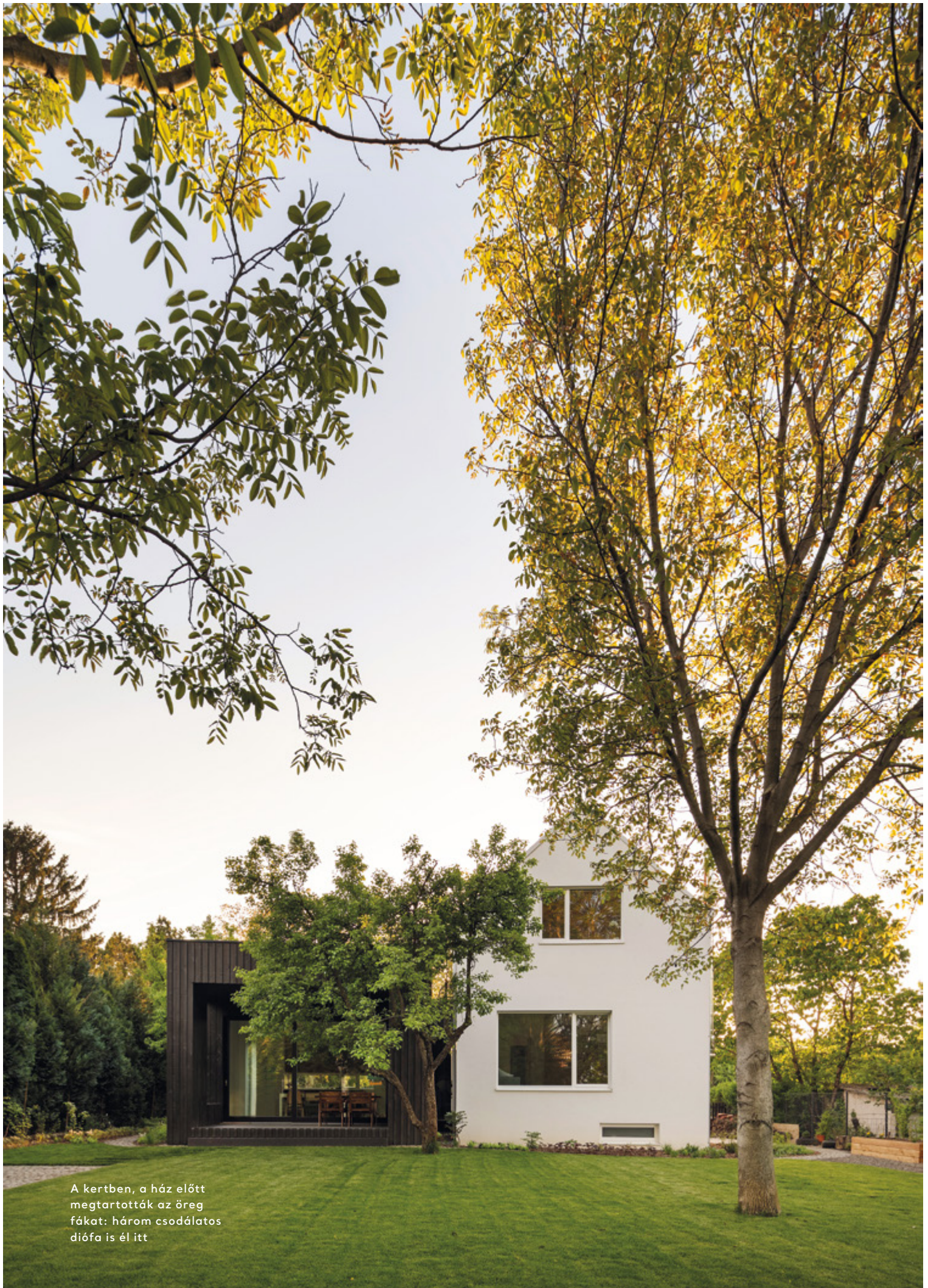
A kertben, a ház előtt megtartották az öreg fákat: három csodálatos diófa is él itt