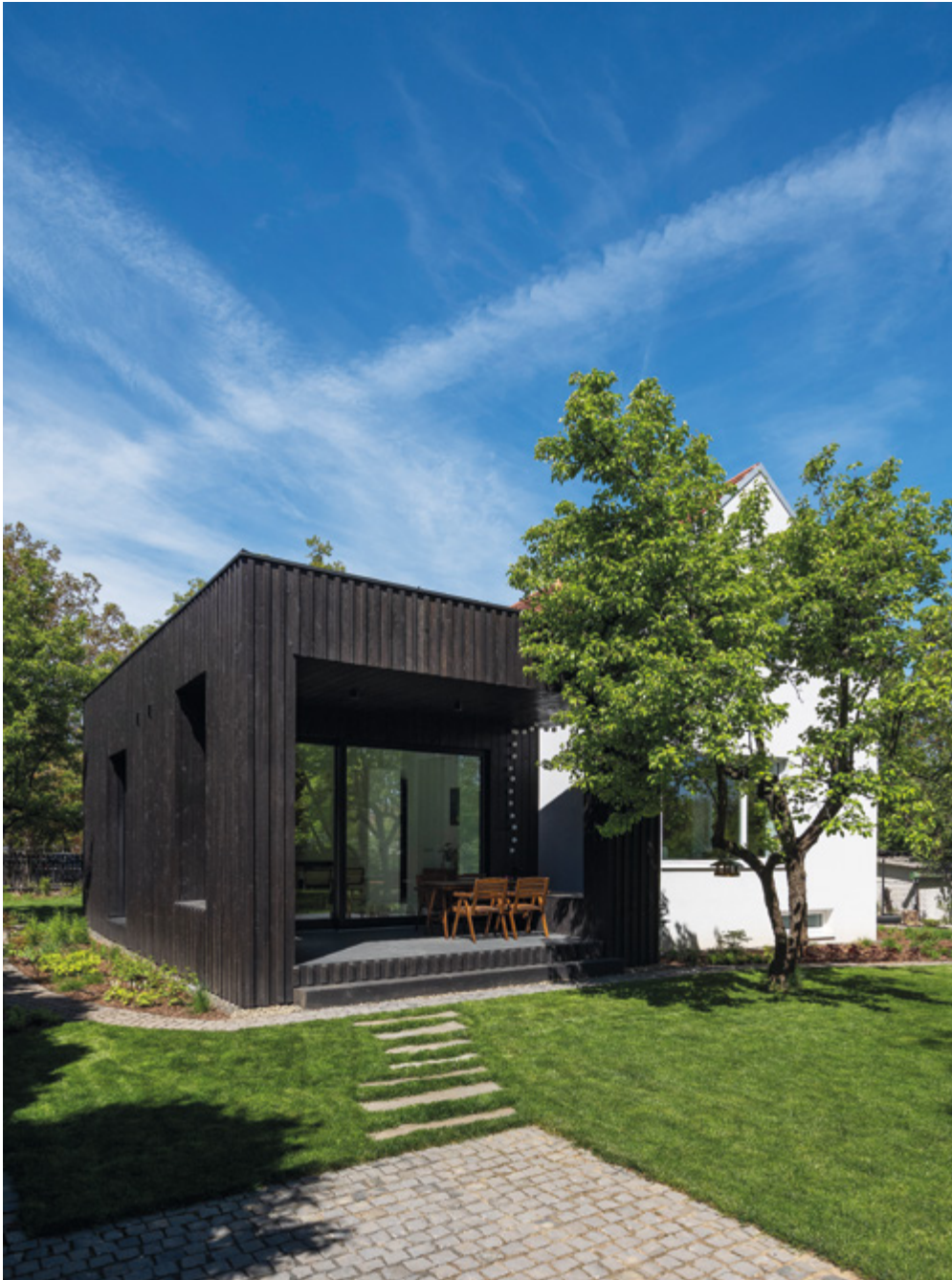
A kertben alkalmazott burkolatok, közüzalékok színükkel, anyagukkal is harmonizálnak az épület színeivel, anyagaival