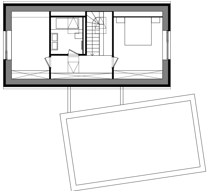
A lapostetős épületrész által közvetlen kapcsolat alakult ki a ház belső tere és a kert között