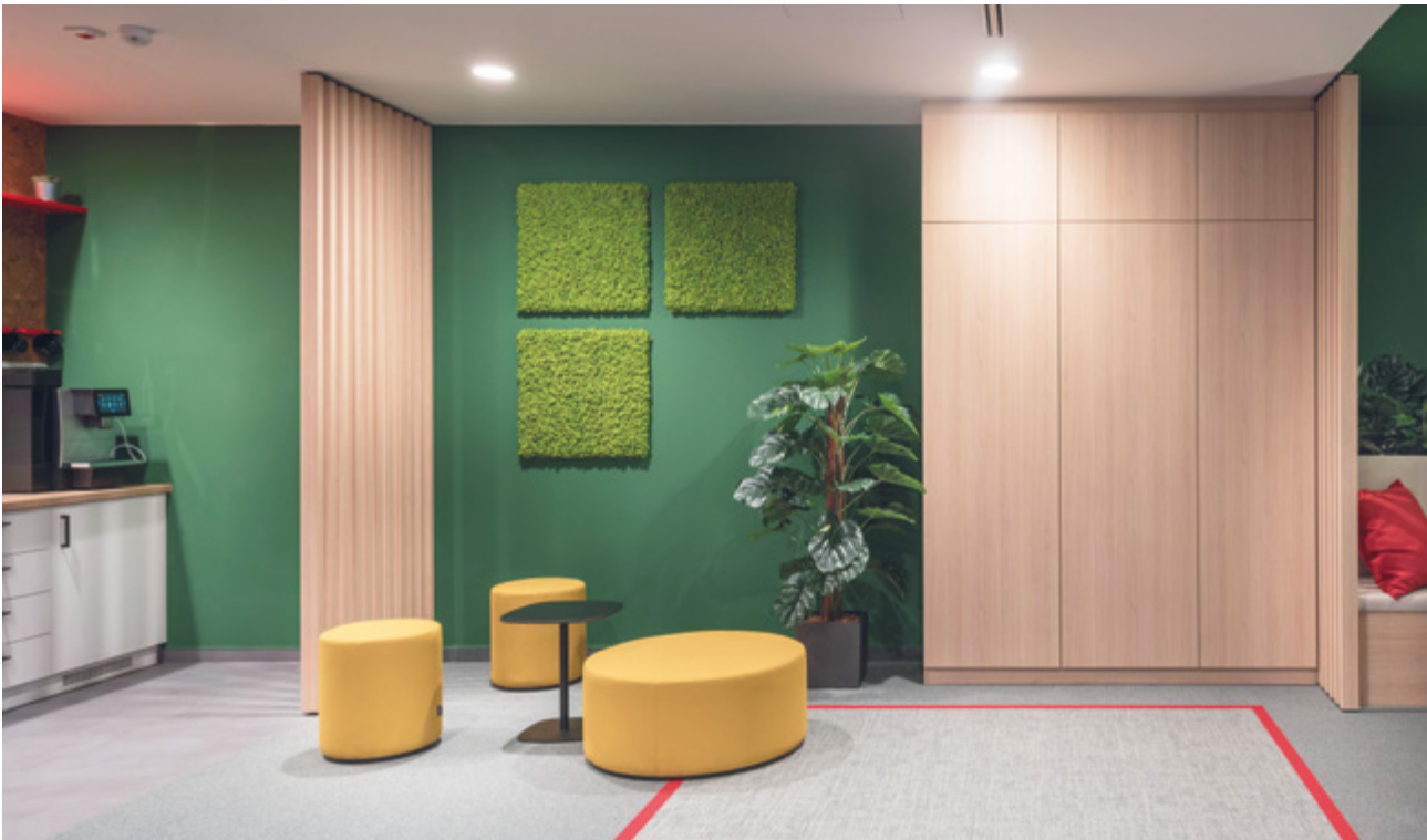
Fa, acél, beton, parafa, sőt még moha felületekkel is találkozhatunk

A tervezési folyamat során a Bükösi Architects arra törekedett, hogy szakítson a külföldi irodák megszokott kialakításával, ahol a fő arculati szín, a piros minden esetben rendkívül erőteljesen, már-már tolakodóan jelenik meg. Igyekeztek kifinomult részletek formájában, éppen csak jelzésértékűen alkalmazni (párnák, folyosói funkcionális elemek, teakonyha polcai stb.) a karakteres árnyalatot. Ez alól csak a teljes mértékben pirosra hangolt, az alapítóról, Martin Hiltiről elnevezett fő tárgyaló képez kivételt, ami ilyen módon kiemelt figyelmet, jelentőséget tulajdonít a jellegzetes színnek.