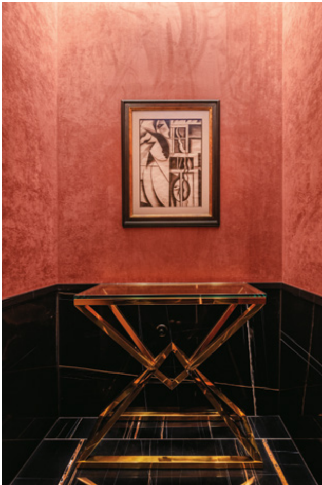
Bujább, budoárszerű részletek