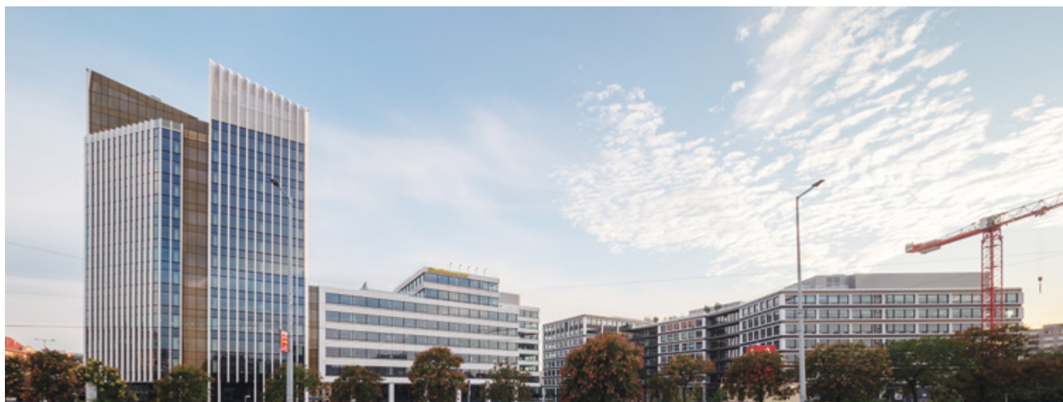
Az Agora Budapest a Váci út felé védőbástyaként magasodik fel, míg a sugaras elrendezésű, alacsonyabb hátsó traktus karéjosan védelmez, csendesebb, félig zárt teret képezve

Az összeszerelhető, elemes homlokzat nagyban hozzájárult ahhoz, hogy az épületegyüttes méreteihez képest viszonylag hamar elkészült. A tervezett kerámia homlokzati elemek helyett, az eredeti elképzeléshez igazodva, markáns,