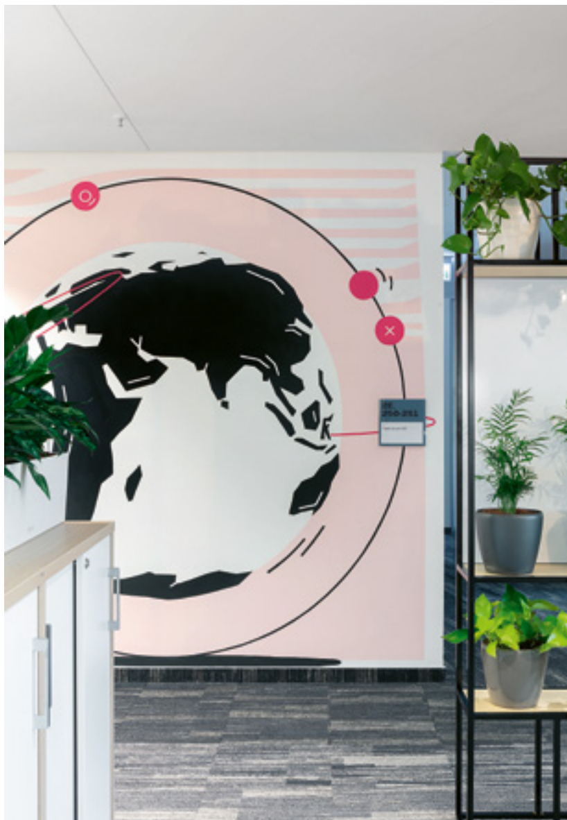
^ A hatalmas grafikai falak nemcsak a tájékozódást segítik