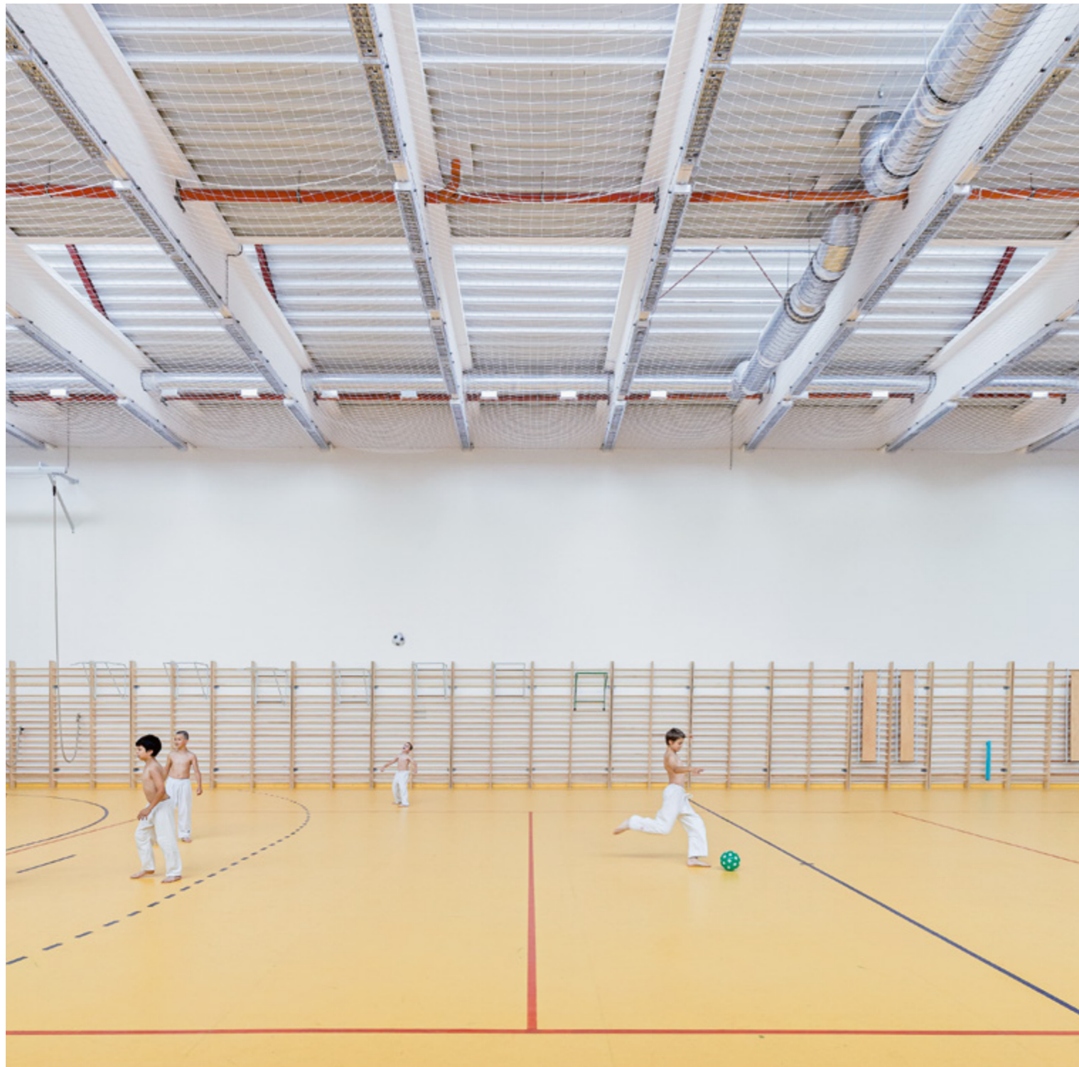
Szórta, kellemes fényt biztosító építészeti kialakítás