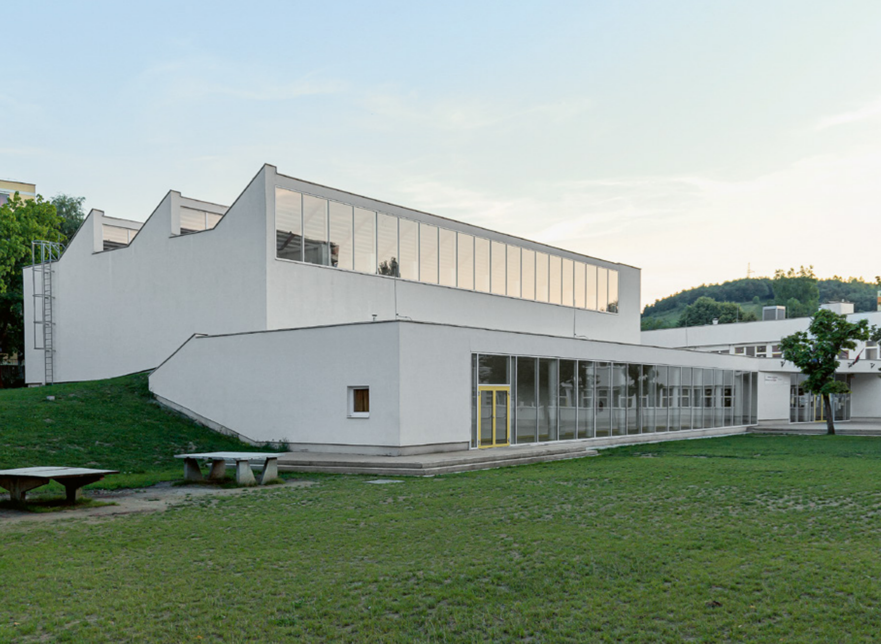
Az új tornatermet a dombor- zati adottságok és a tájolás szerint helyezték el

Napjaink Ózdjára sajnos nehéz a remény és az optimizmus városaként gondolni. Noha Ózd a 19. század óta az ipari innováció és mérnöki szakértelem egyik régiós központja volt, manapság nem tudunk a szocialista nagyipar, a privatizáció kudarca ejtette sebek nélkül a városra tekinteni. Ráadásul az elmúlt három évtizedben sem körvonalazódott valódi identitást teremtő, átfogó támogatási terv, ami az ország észak-keleti régióját remény-nyel hatja át, segíti, a jövő felé fordítja. Ilyen reményt és új identitást adhat egy városnak a jó és megalapozott kortárs építészeti is, ami habos elvagyódás és kisszerű illúziómakettek helyett a város valódi értékeit tárja fel, önbizalmat és optimizmust sugároz a városlakók felé. Ennek a folyamatnak