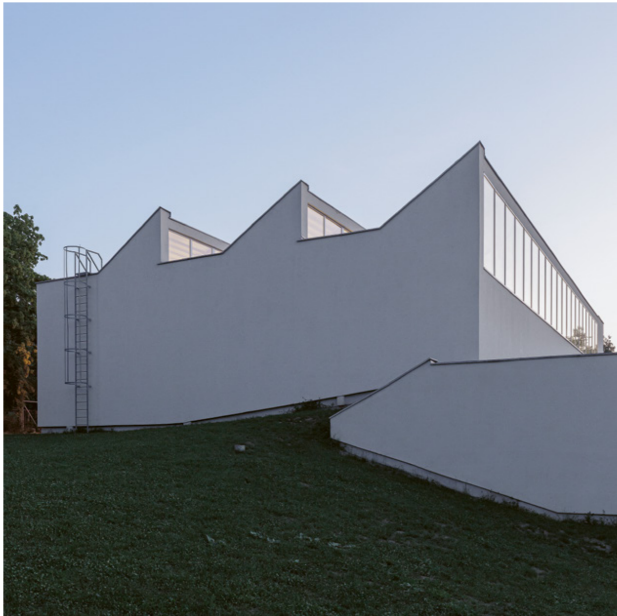
Az épületegyüttes legmeghatározóbb építészeti eleme a tornaterem séd-tetője