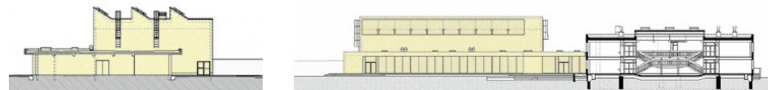
Az új tornaterem telepítésénél olyan megoldást kerestek a tervezők, ahol az új és a régi épületrészek egy ponton közelíthetők meg

Szintterület (bruttó): 4700 m 2 Tervezés éve: 2012 Építés éve: 2015