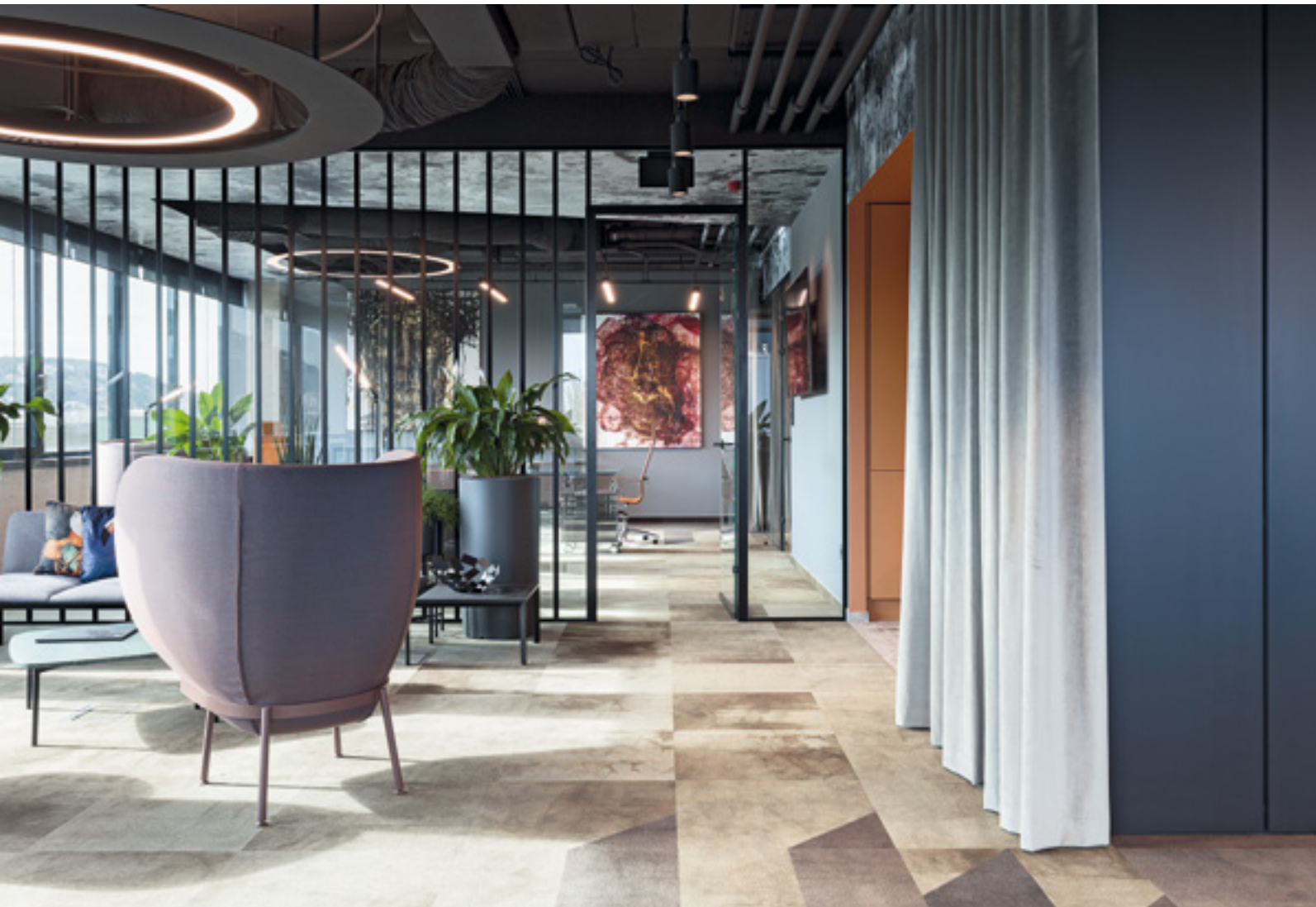
Sorozat: MOLNÁR SZILVIA Forró: DANYI BALÁZS Építészeti: LEAN TECH MÉRNÖKIRODA