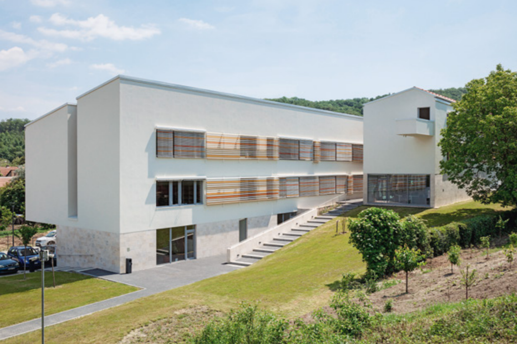
Az új városháza fontos fókuszpontja lehet a városnak