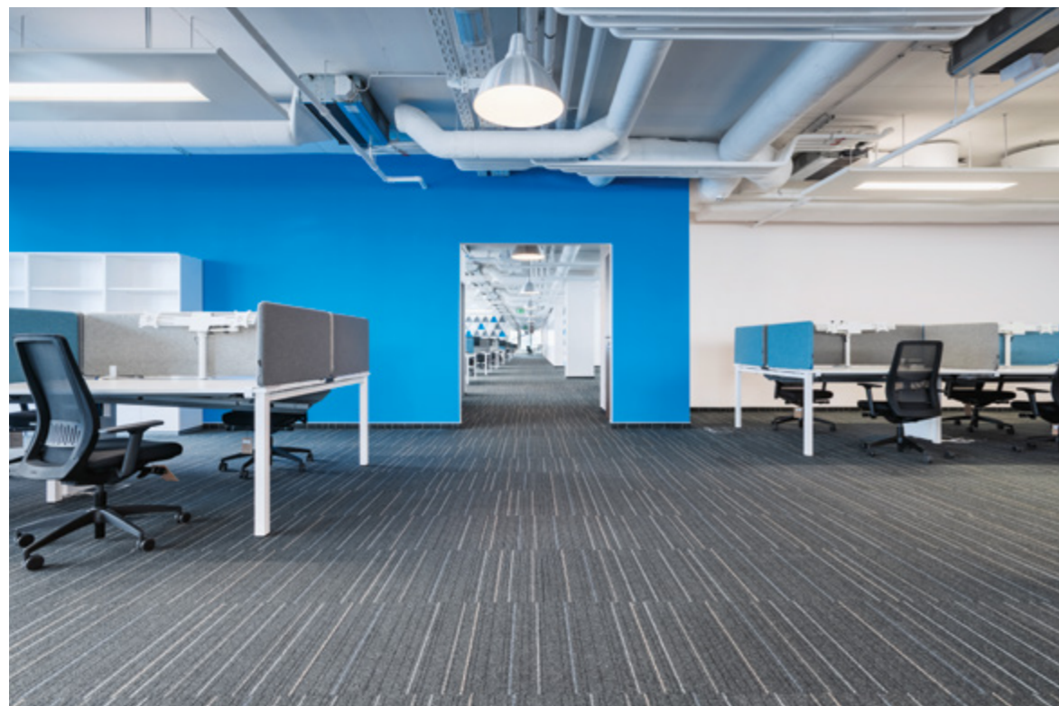
< Az ipusztuialis karakter nem enged unalmat