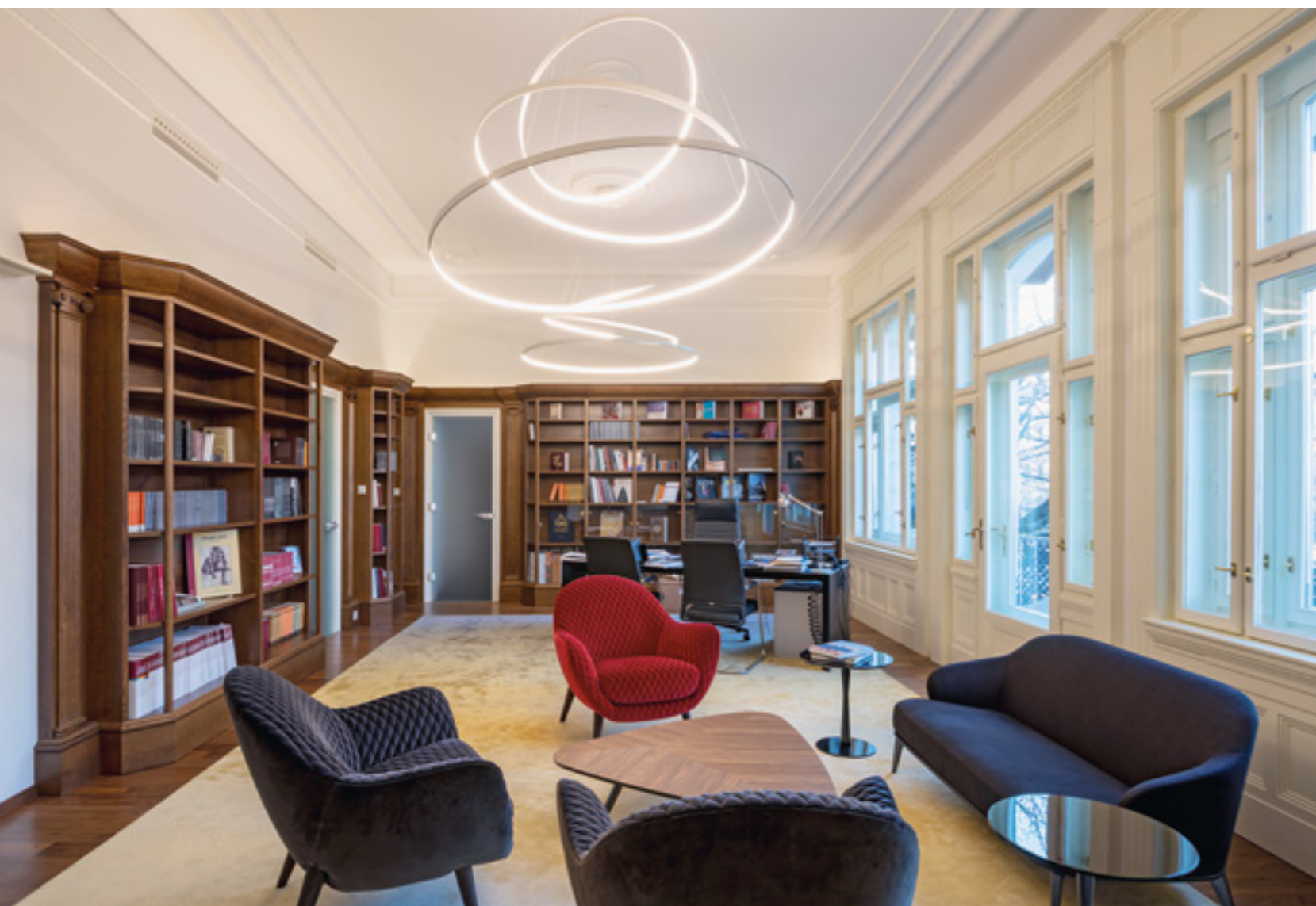
^ Az elnöki dolgozószoba, kortárs bútorokkal és világítótestekkel.

disztópikus sci-fibe illő folyosók és irodák kerültek, a székház adminisztratív funkcióinak megfelelően.