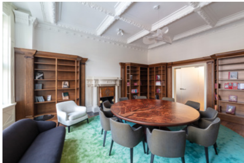
« Az elnökségi tárgyaló intarziás asztala Fazakas Nikoletta terve alapján készült