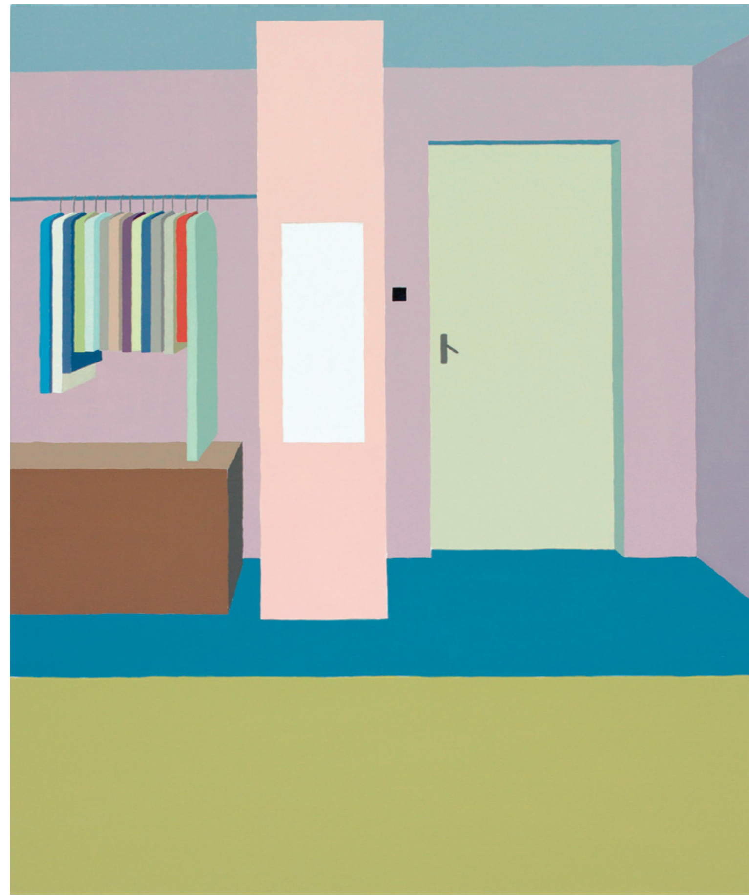
Sándorfalva, Hungary #28, akril x vászon, 150 x 180 cm, 2016