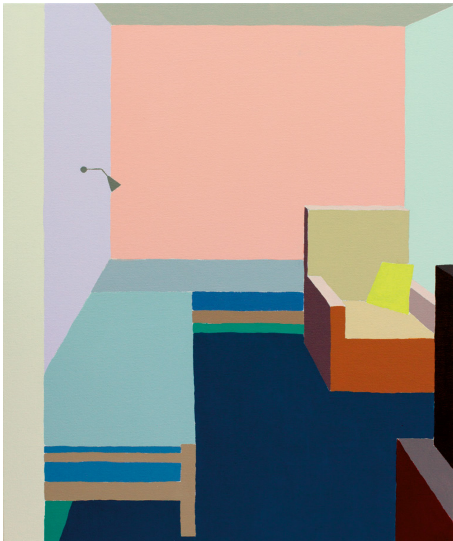
Sándorfalva, Hungary #29, akril x vászon, 50 x 60 cm, 2016