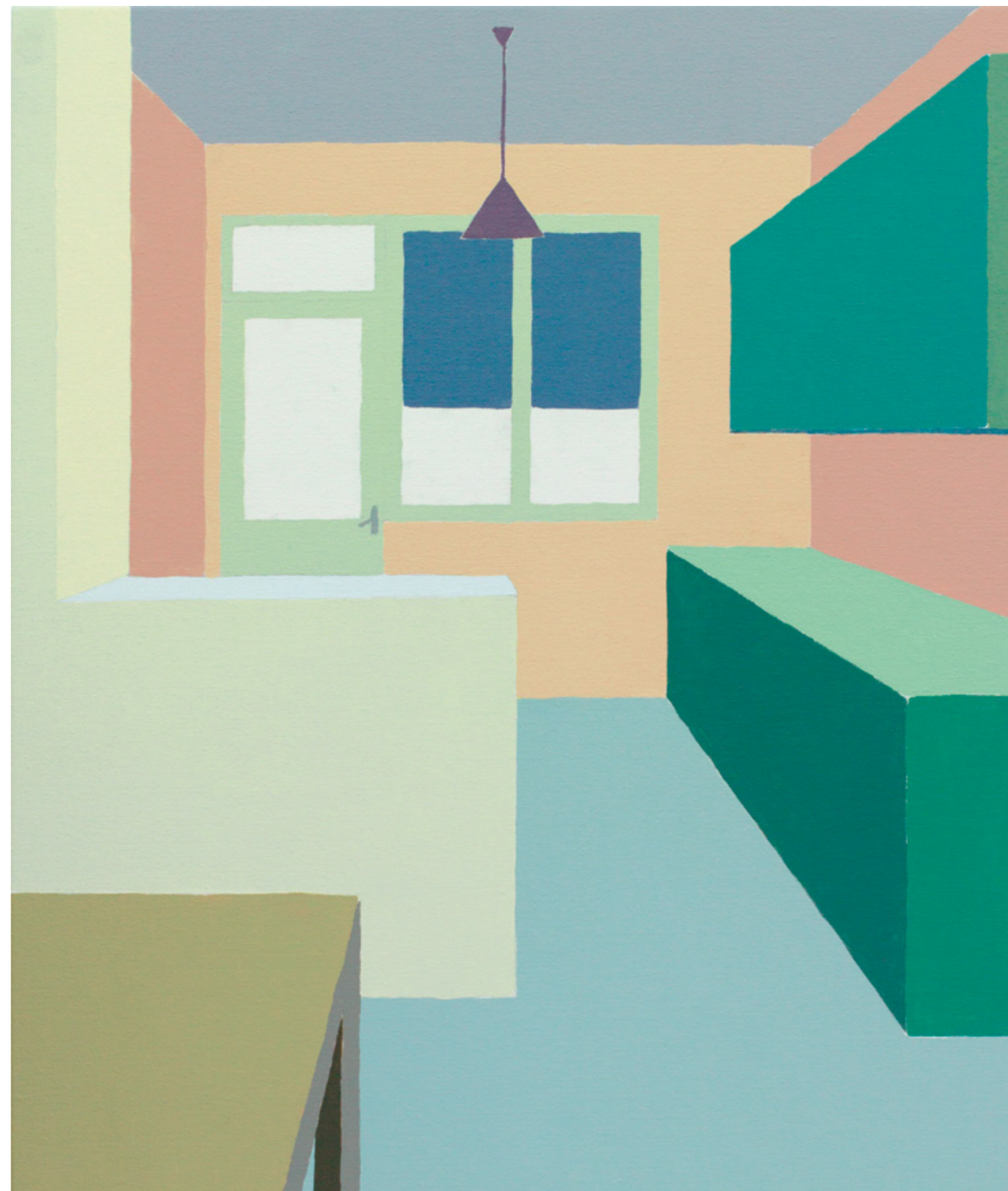
Sándorfalva, Hungary #32, akril x vászon, 50 x 60 cm, 2016; az alkotó jövőtábjól