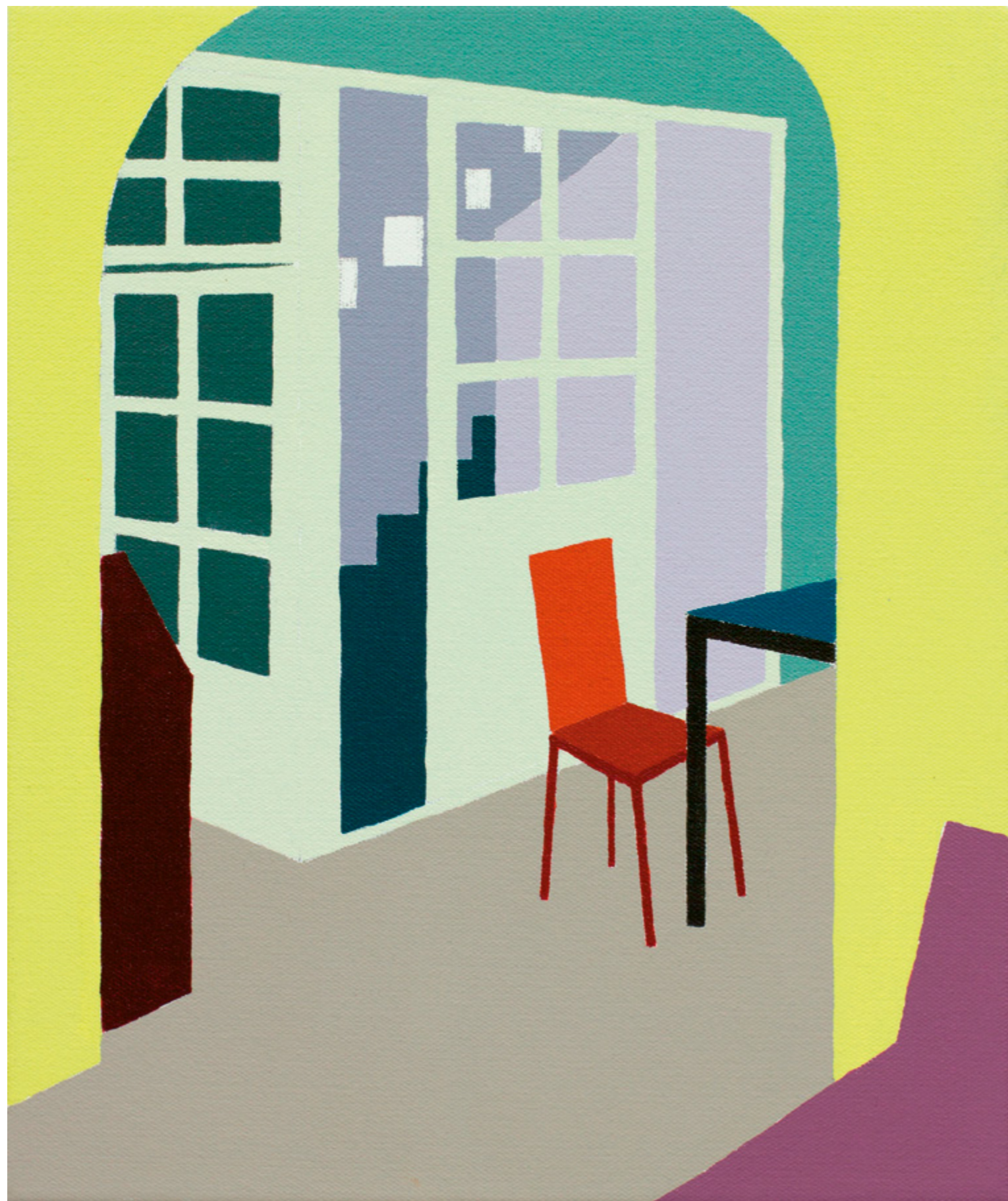
Sándorfalva, Hungary #22, akril x vászon, 25 x 30 cm, 2016; az alkotó jóvoltából