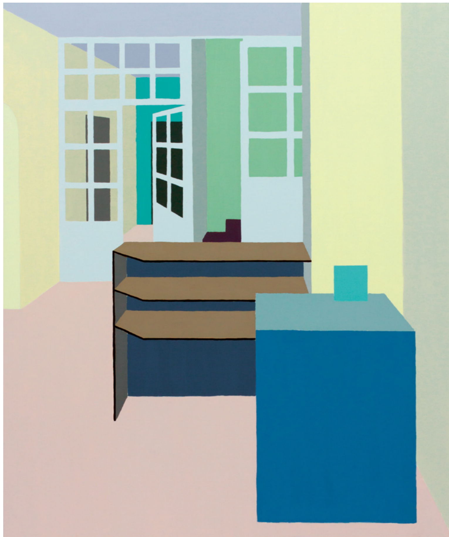
Sándorfalva, Hungary #25, akril x vászon, 150 x 180 cm, 2016; az alkotó jövőtábjól