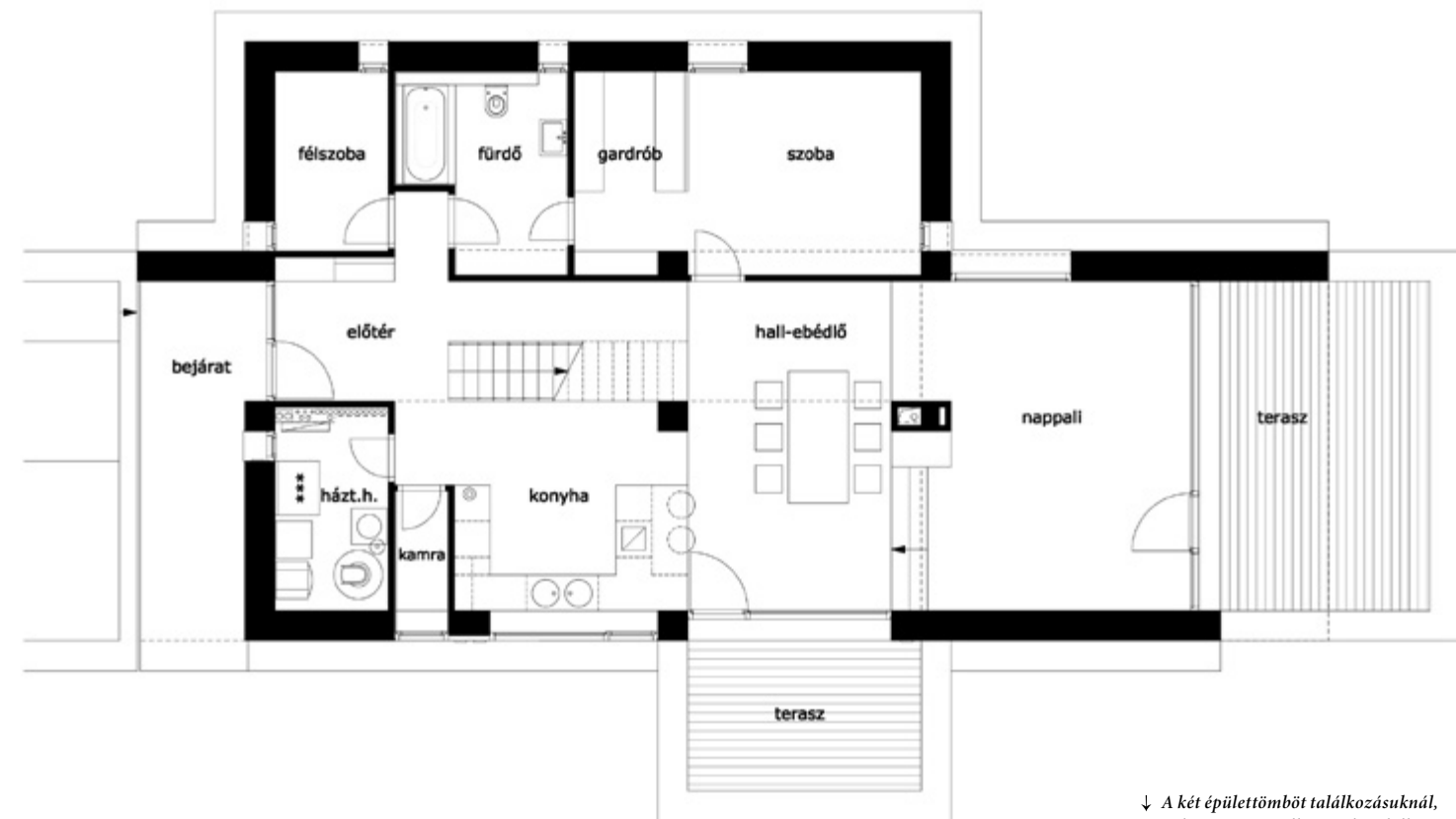
↓ A két épülettömböt találkozásuknál, azaz középen egy pillér és a kandallót is magába fogadó T idom tartja

E ház határozottan nem is villa, amikkel egyébként szerencsére manapság már egyre gyakrabban találkozhatunk. Tehát nem villa, mert méreteiből, a bepakolt funkciókból célzatosan hiányzik az az extrém faktor, amit a kivagyiság vagy kivételességre törekvés táplál. Szóval elsősorban csak lakni akarunk valahol, és a körítés nem számít annyira.