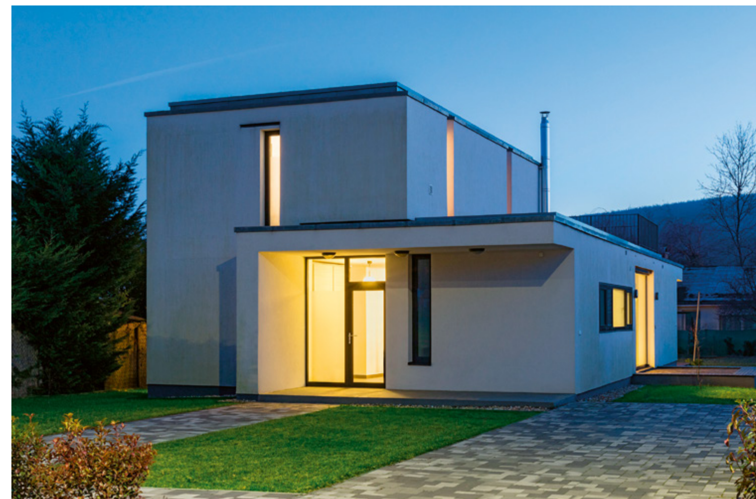
↓ A bejárat egyben tengely is lesz: ami hátul az épülethez tapadó teraszban végződik

ebbe a városzéli mindenfélebe, de ez nem igaz, mert közelébe érve már csak vele foglalkozunk. Tömbszerű tömörség, ami belül levegős egyetűrségre vált, az előtérből előbb a konyhasarokba lépünk, majd az ebédlő rész mellett tovább haladva eljutunk a nappaliig – ami már újra kint, a nagyobbik teraszban folytatódik. Szolid lehatárolásokkal, nyugodt, homogén felületek között haladunk előre (a két épülettömböt találkozá-