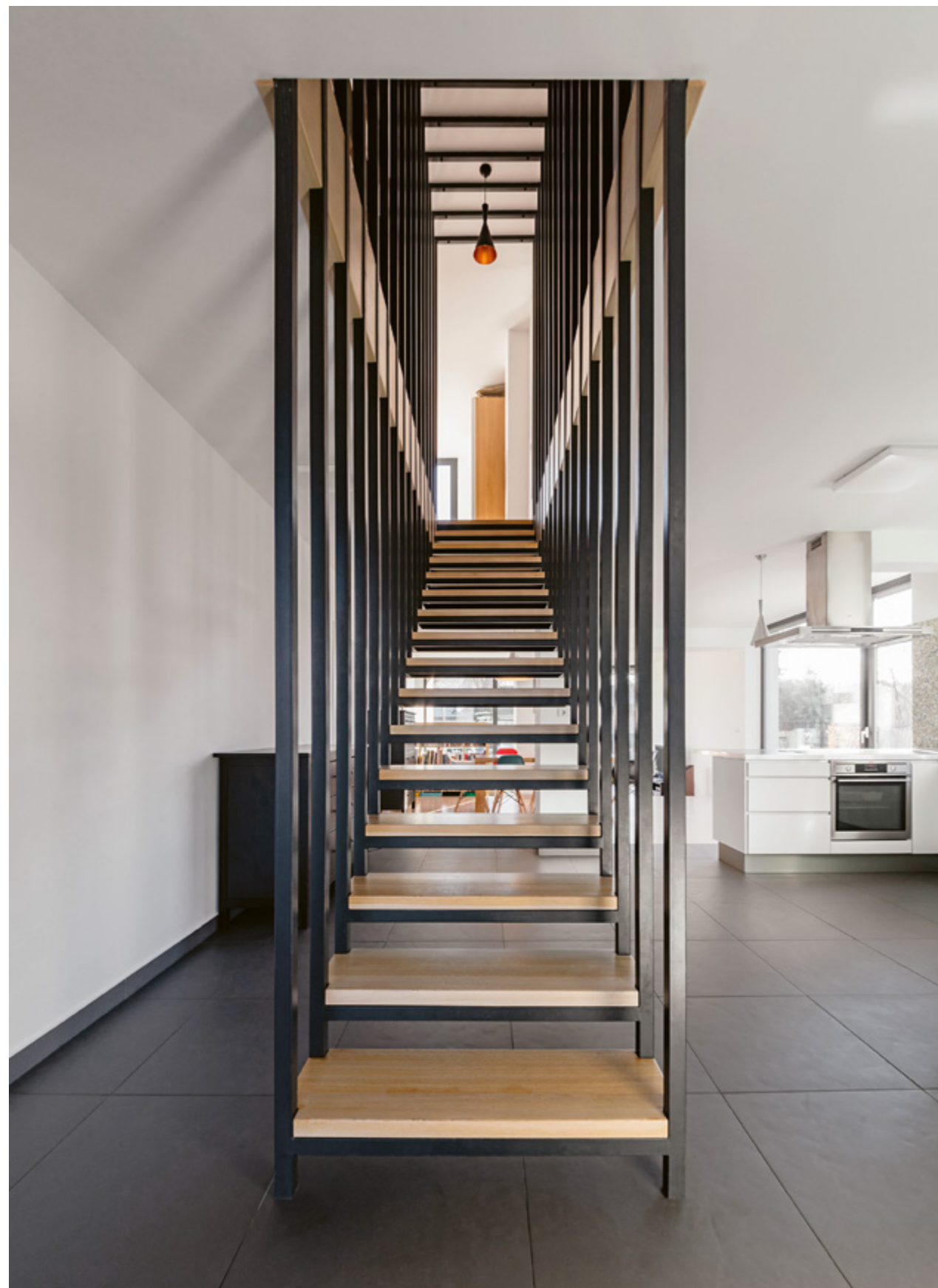
← Az enteriőr hangsúlyos eleme a lebegő hatású lépcső

Vezető tervező: Tima Zoltán Munkatársak: Hegedűs Judit, Schreiber Gábor Alapterület (nettó): 165 m 2