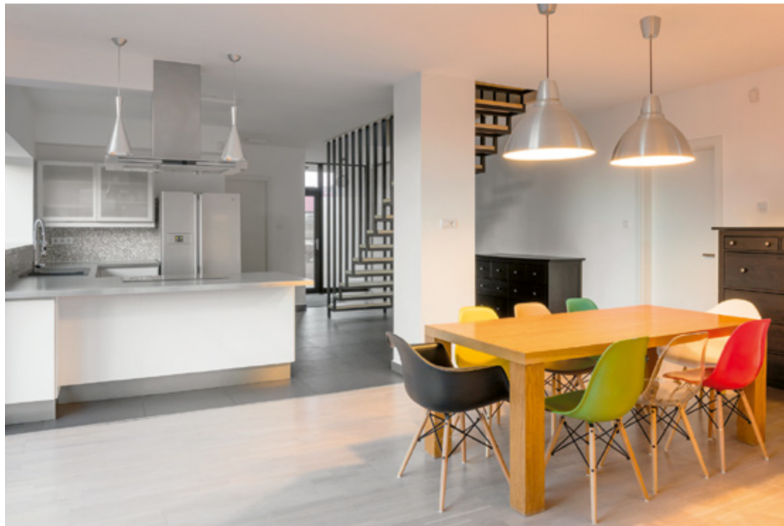
← A bútorzat szint ad a homogén belvilágnak