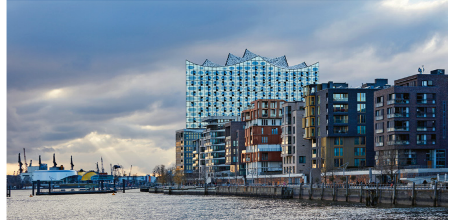
↑ A kakaó- és kávéraktár az egykori szabadkikötő északi végében állt, rajta újabb 37 méter az Elbphilharmonie – ennek tetején pedig az 1,7 milliós kikötővárosra nyíló panorámaterasz.