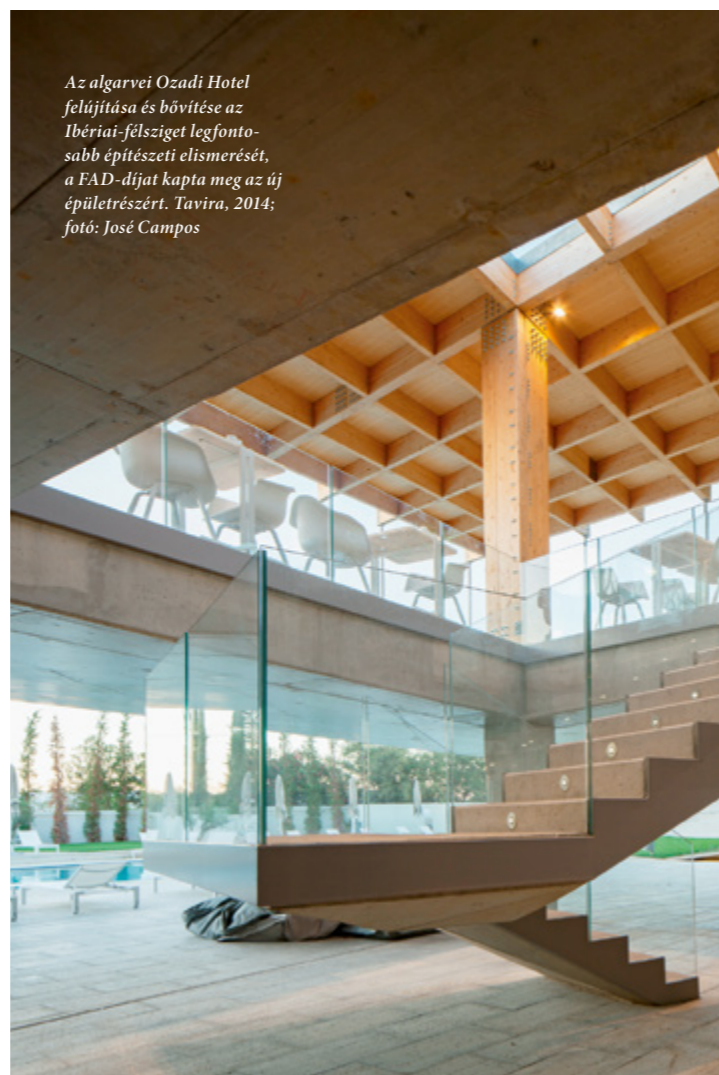
Az algarvei Ozadi Hotel felújítása és bővítése az Ibériai-félsziget legfontosabb építészeti elismerését, a FAD-díjat kapta meg az új épületrészért. Tavira, 2014; fotó: José Campos

Akkor tíz év alatt ment el ennyi ember, most két év alatt. És a mostani hullám esetében nem képzetlen munkaerőről beszélünk, mint ami a '60-70-es évekre volt jellemző, amikor az olcsó portugál munkaerő elárasztotta Franciaországot, Svájcot. Ezeknek az embereknek a felsőfokú oktatását az állam, az adófizetők finanszírozták, és egyszer csak tömegével elmentek. Magasan képzett, kitűnő munkaerők, akik nélkül esély sincs arra, hogy Portugália fejlődjön, gazdagodjon. Azt akartam, hogy legyen egy ok, egy konkrét munka, amiért érdemes visszajönniük, már ha még lehetséges egyáltalán, de ne Velencébe, hanem haza, Portugáliába.