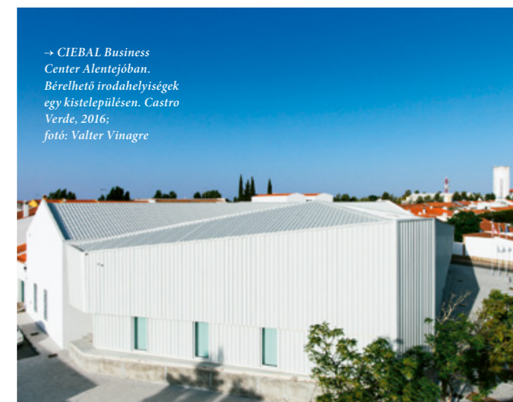
→ CIEBAL Business Center Alentejóban. Bérlehető irodahelyiségek egy kistelepülésen. Castro Verde, 2016

Szóval szeretem a focit, követem Mourinhót, meg a többi labdarúgóedző munkáját, mert érdekel, hogyan kezelik a csapatot, hogyan irányítják a játékosokat, egyszóval a futball elmélete is érdekel. Most például mindenki csodálja az Atlético de Madridot, mert alig kapnak pénzt, kicsi csapat, mégis hihetetlenül jó arányban nyerik a meccseket, nem is tudom, van-e még ilyen a világon. És mi a sikerük titka? Hogy meccsről meccsre játszanak. Ez az én stratégiám is. Nehezebb meg fárasztóbb minden egyes alkalomra máshogy felkészülni, minden projektet máshogy csinálni, de mégis hatékonyabb. Időnként azért ijesztő volt több mint 100 embert összefogni, de volt segítségem. Sok lelkes, de épp akkor alulfoglalkoztatott építész,