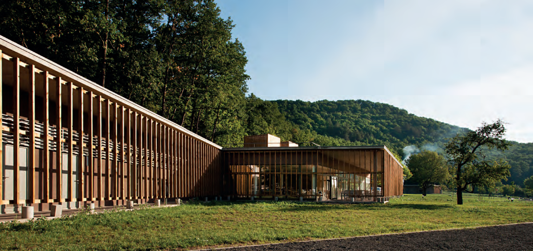
A fapilléres tornác harmonizál a természeti környezettel