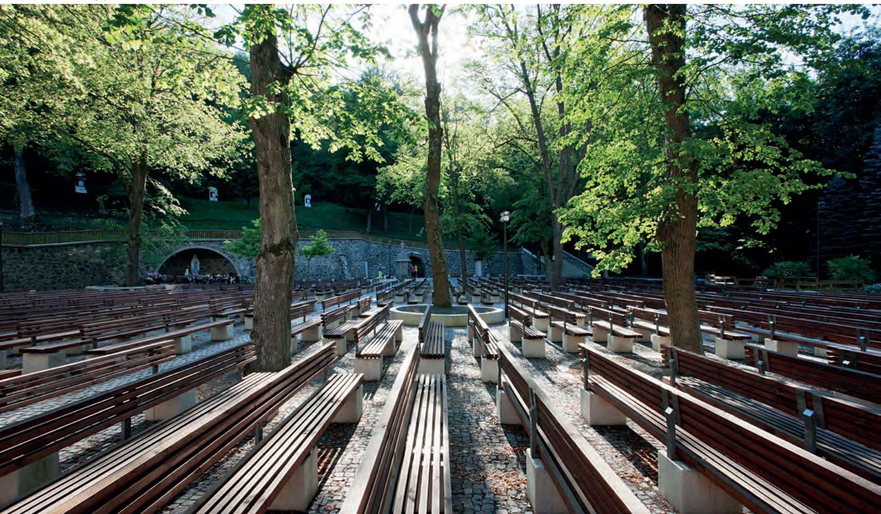
A megújult szabadtéri misézőhely ritmikus padsorai

Magyarország (talán) leglátogatottabb zarándokhelye rangjához méltatlannak mondható környezettel fogadta még nem is oly rég az ide zarándoklókat, mígnem 7 éve a pasaréti ferences házból ide rendelt Peregrin atya vezetésével