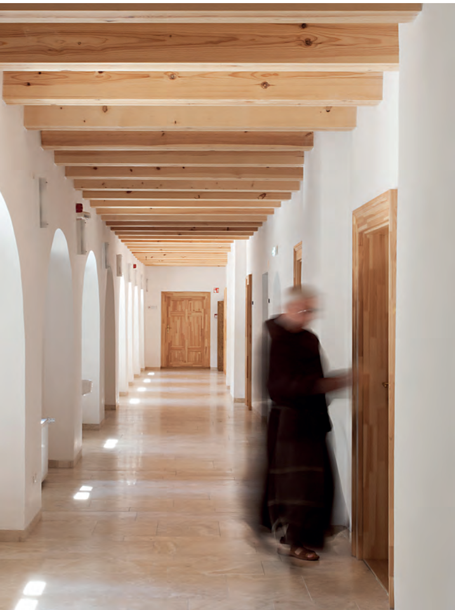
Felújított kolostorépület: szerzetesi egyszerűsége törekvés