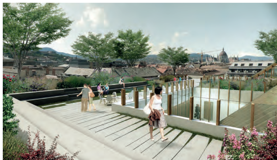
Látványtervek: O'Donnell + Tuomey/CEU

JT: Egy-két tucat kollégával dolgozunk. Olyan ez, mint egy nagy család,