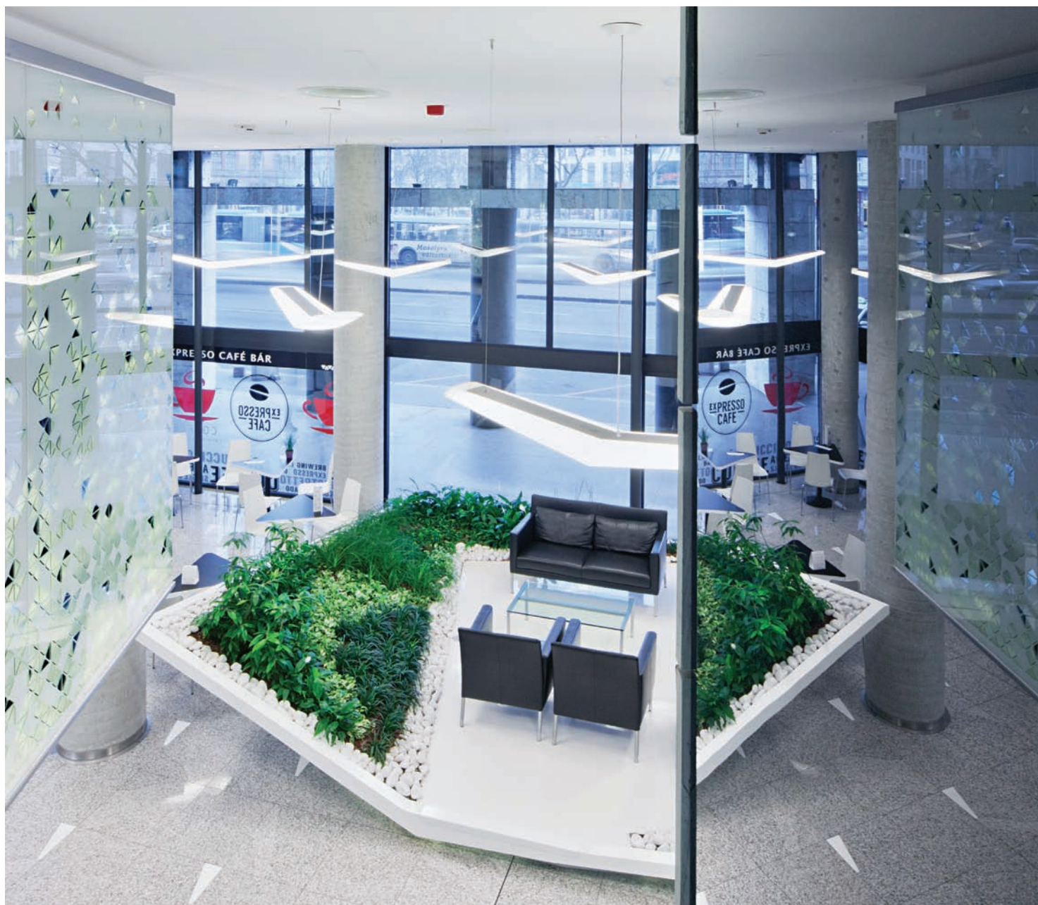
20 év után szükségessé vált a belsőépítészeti megoldások átgondolása, a belépő tér újraértelmezése

Erzsébetváros szívében, a Blaha Lujza téren található EMKE eredetileg századfordulós épülete a kávéházi kultúra fontos szimbóluma volt. 1945-ös kiégése, majd az '56-os forradalom közben keletkezett pusztítások a klasszikus szerkezetet teljesen megsemmisítik. A rendszerváltást követően készül el a homlokzat jelenleg is látható, alapvetően üvegdominanciára épülő lekerekített formavilágot megjelenítő tömegkezelése, amellyel az iroda