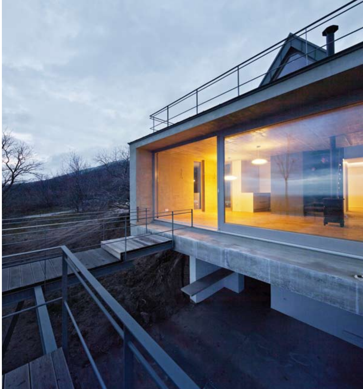
Szinte lebeg a ház a kövágószőlői lankákon, a teraszos kialakításnak köszönhetően

A tervezői koncepció révén sikerült egy olyan belsőt létrehozni, ahol inkább a tájban érezzük magunkat, s nem attól elzárva