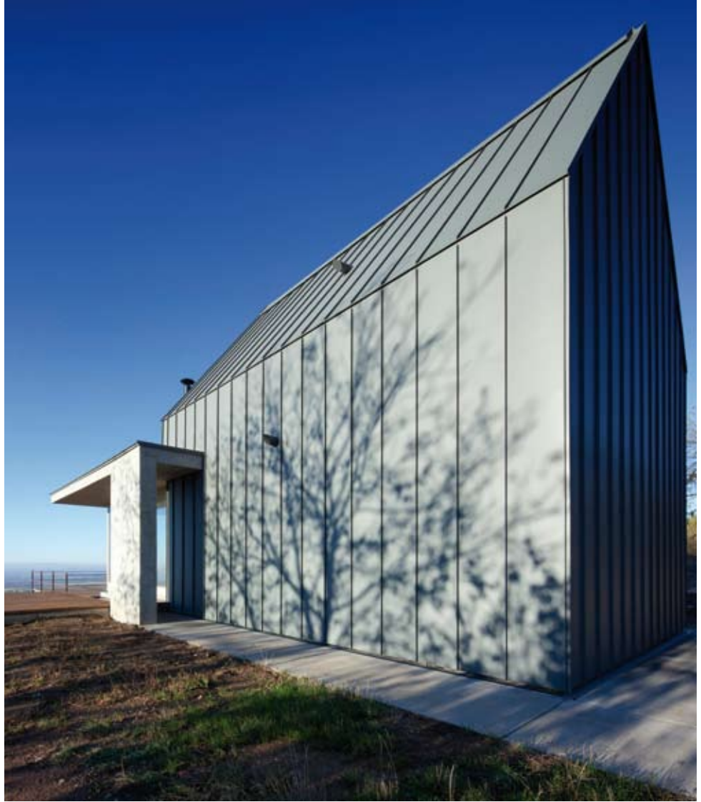
A hegy felőli oldalon zártabb, tiszta vonalú képletet mutat az épület

Az épület külső tagolásában is markáns különbségek fedezhetőek fel. Az eredetileg meglévő, magastetős kis présházforma korrólított fémlemezfedést kapott, míg a lapostetős tömeg látszóbeton felületű kint és bent egyaránt. A ház anyaghasználatánál fontos szempont volt az energiahatékonyság, illetve, hogy ne igényeljen állandó karbantartást. A ház befejezésekor a szülői hálószoba és a gyerekszoba felcserélődött,