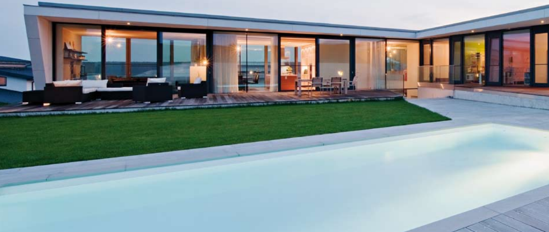
A tágas kert és a táj összefonódnak az épület nagyvonalú tereivel