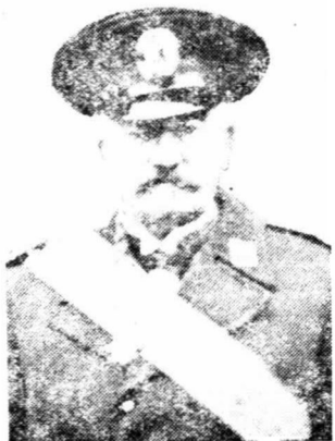
Al. Vaida Voievod a Nemzeti Ujjászületés Arvonai elnöke, kir. tanácsos.

A törvényhozás ülészeit berekesztő királyi kéziratnak a képviselőházban történi felolvasása után Vaida Voievod elnök közszózatát mondott a kormány tagjainak, a törvényhozóknak kifejtett tevékenységükért. A ház bezárása után felhívta a román népet, hogy tanúsítson összetartást és visszkérdjen megértően az ország kisebbségi népeivel szemben. Ilyen módon — mondotta Vaida — az ország megőrizheti szigorú semlegességét a fennálló szerződések keretében.