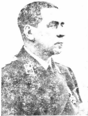
Gheorghe Tătărescu miniszterelnök, királyi tanácsos.

Április 19-én bezárták a román törvényhozás ülészeit. Ezután a kormány G. Tătărescu királyi tanácsos miniszterelnök elnöklésével minisztertanácsot tartott.