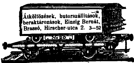
Átköltözések, butorszállítások, beraktározások, Einzig Bernát, Brassó, Hirscher-utca 2. 3-52

Minden szombaton bérvágásokat elfogadnak.