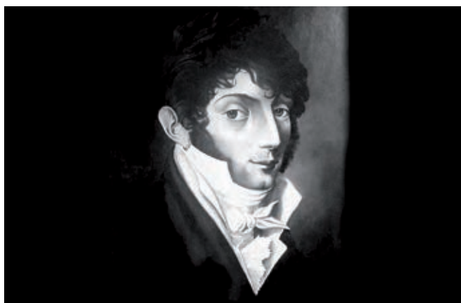
Mauro Giuliani.

Ferdinando Carulli (1770–1841) olasz gitárművésznek és pedagógusnak köszönhetjük a legkellemesebb és legkönnyebben elsajátítható tanulmányokat, táncdarabokat, szóló- és kamaraműveket. Gitáriskoláját és az általa kifejlesztett tízhúros gitárt (négy basszshúrral) manapság is használják. Eredetileg ő is csellózni tanult, akárcsak Mauro Giuliani (1781–1828), aki élete nagy részét Bécsben töltötte. Művészetét a legnagyobb hangszeres előadókhoz hasonlították, sőt a „gitár Paganinija”-ként is emlegették. Beethovennel személyes kapcsolatban állt, a kor zeneszerző-zongora-virtuózai, Johann Nepomuk Hummel és Ignaz Moscheles is nagyra tartották művészetét. Hummel több szóló- és kamaraművet írt gitárra, Giulianival koncertezett is.