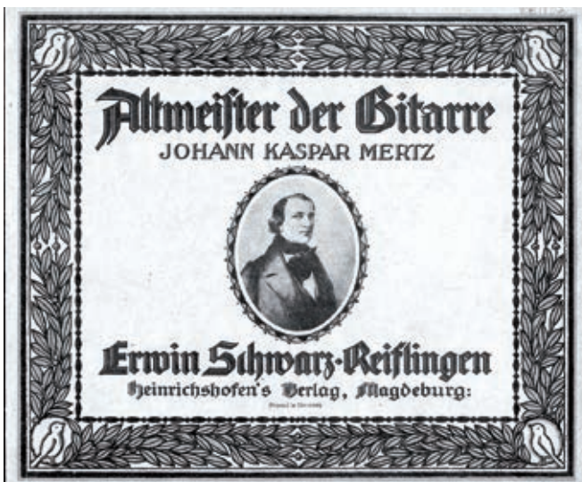
J. K. Mertz gitárgyűjteményének borítója, 1920.

Bermudo Juan (1510–1565) spanyol szerző ismerteti könyvében a vihuela comun , azaz normál vihuela hangszert, amelynek hangolása (dupla húrral) megegyezik a mai gitáréval. A guitarra ennek kicsinyített változata, a nagyobb, basszushangszer. A 17. századi Anglia népszerű hangszere a cister (4-7 vagy akár 13 húrral): kör alakú hangszer, átmenet a lant és gitár között (további nevei: cittern, cithern, cistre, cetera, cithara). 1788-ban J. G. Stauffer létrehozta a violoncell-citarre -t, amelyen vonóval játszottak, és csellóalakja volt. A chitarra battente (öblösgitár) Olaszországban lett népszerű a 17-18. században. Ezt már pengetővel szólaltatták meg, s ez a mai jazzgitár őse. A nehezebben hangolható bélhúrokat csak a 20. század elején tudták felváltani a sokkal praktikusabb nejlónhúrokkal. Ebben a formájában a klasszikus gitár valódi koncerthangszerre vált. Hogy miként hódította meg a legnagyobb koncerttermeket, arról írásunk következő része fog beszámolni.