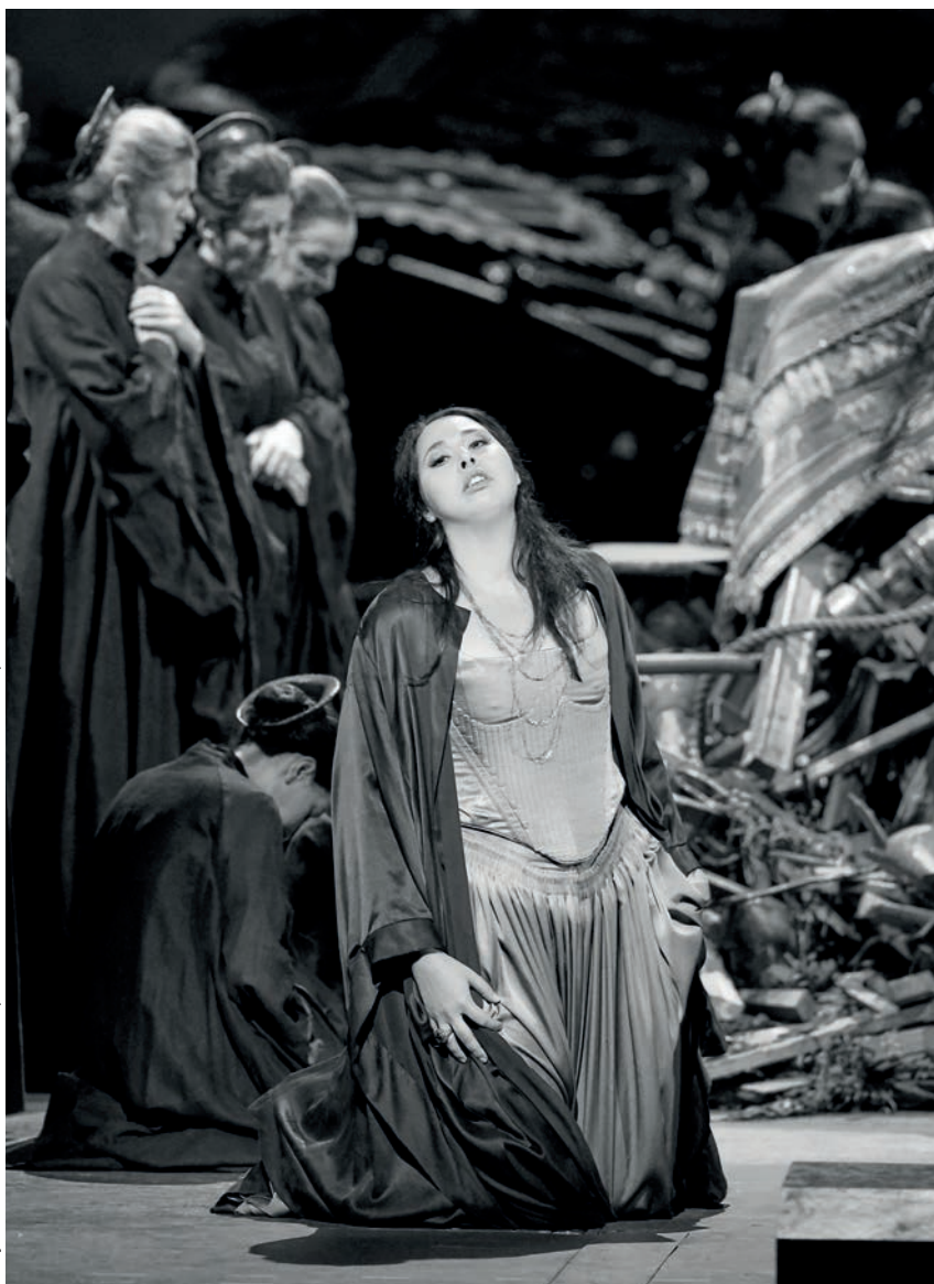
A trójaiak előadásán a bécsi Staatsoperben.

Korábban már néhány esztendőt énekelt a budapesti Operaházban. Mi volt Bécsben a legnagyobb meglepetés? A próbák, az időbeosztás, a munka intenzitása?