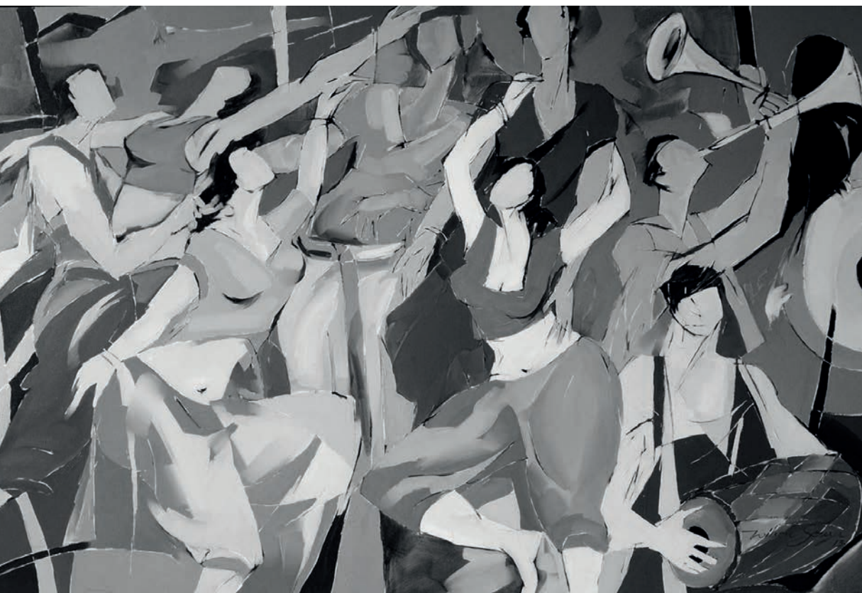
Wilson Souza: Zenei extázis (2014, olaj, vászon).