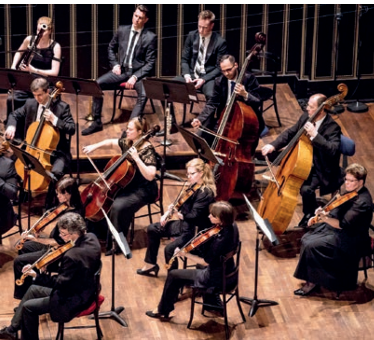
A Concerto Budapest.