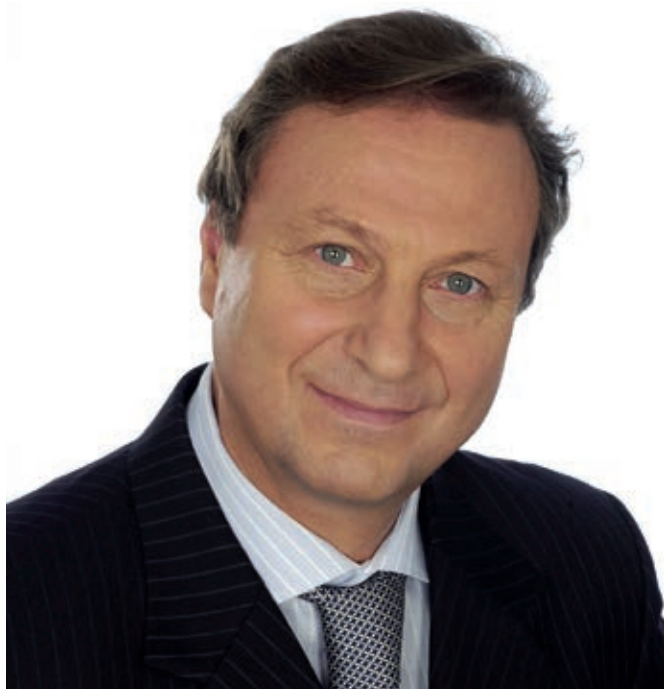
Fokanov Anatolij.

Április 27-én orosz estet ad az Óbudai Társaskörben hazánk egyik vezető baritonénekes, Fokanov Anatolij. A művész négy évtizedes pályáját ünnepli a különleges koncerttel melyről így nyilatkozott: „Mindig szerettem a daléneklést, de a tapasztalat azt mutatja, hogy a magyar közönség is szívesen hallgatja ezeket a gyöngyszemeket. Az Opera színpadáról főleg olasz darabok szereplőjeként ismernek, ezért most a dalok mellett népszerű orosz áriákat is előadok.” Az énekes több mint 25 éve a Magyar Állami Operaház szólistája, ahol elsősorban a Tosca Scarpiájaként, illetve a Rigoletto címszereplőjeként írta be magát a magyar operatörténetbe. „Szinte minden előadásra, koncertre és dalestre szívesen emlékszem vissza. Mint már többször említettem, a magyar publikum hozzáértése és lelkesedése a szép zene iránt egyedülálló!” Erkel színházbeli fellépései mellett számos egyéb koncert is vár rá az elkövetkező időszakban: „Április végén a Tavaszi Fesztiválon Dvořák Te Deum ában énekelek, júniusban pedig a Rádió Márványtermében adunk ismét orosz dalestet Virág Emesével. A következő évadot a II. Orosz Zenei Fesztivállal kezdem Budapesten, majd novemberben az Erkel Színházban az egyik kedvenc szerepemmel, Rigolettóként lépek fel.”