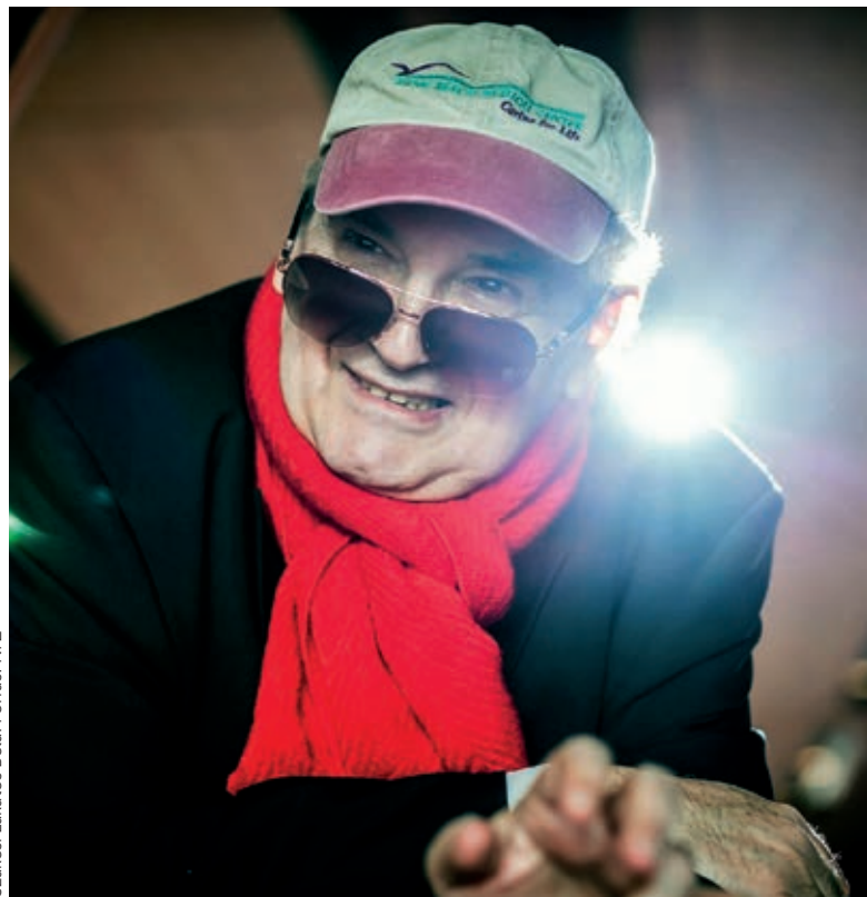
Szakcsi Lakatos Béla.

A tavaly 75. életévét betöltő Szakcsi Lakatos Béla életműdíjban részesült. A zongorista ötvenes évek óta töretlenül felfelé ívelő pályáján a mainstream jazz, a jazzrock, a new age, a szabad improvizáció és a gypsy jazz irányzatokban is maradandót alkotott. A Liszt- és Kossuth-díjas művész zenéjében különösen nagy hangsúlyt fektet a klasszikus és kortárs zene, a világzene és a jazz ötvözésére. Rendkívül széleskörű a klasszikus zenei műveltsége, és elhivatottan kutatja a lehetőséget, hogy az eddig elkülönülő zenei műfajokból közös nyelvet teremtsen. Az utóbbi időben behatóan foglalkozott Stravinsky, Kurtág György és Ligeti György műveivel, melyekre rendszeresen improvizál is, s ezekből lemezeket is megjelentet. Szakcsi Lakatos Béla nem melleleg az egyetlen művész, aki a Gramofon-díj történetében két alkalommal is átvehette az elismerést: először 2004-ben, Na dara! (Ne félj!) című lemezéért, s azzal együtt a gypsy jazz stílus létrehozásáért, megformálásáért.