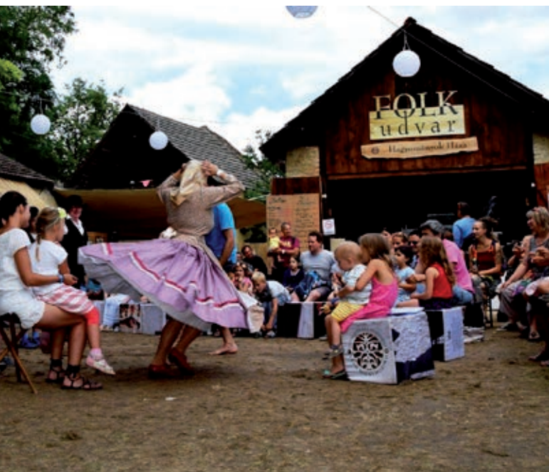
Pillanatkép a tavalyi Folkudvarról.