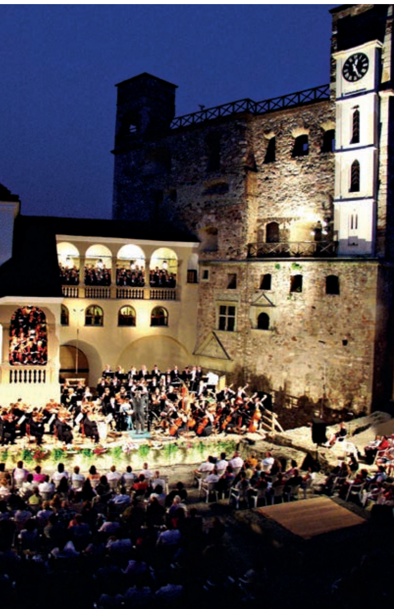
Koncert a sárospataki vár udvarán.

A Zempléni Fesztivál zárókoncertjére augusztus 19-én, Sárospatak újra várossá nyilvánításának 50. évfordulója előestéjén kerül sor, és a fesztivál történetében először a Magyar Állami Operaház zenekara lép majd színpadra, Medveczky Ádám vezényletével. A Rákóczi-vár udvarán olyan művek hangzanak el előadásukban, melyeket nekik, azaz a Filharmóniai Társaság zenekara számára írtak, például Dohnányi Szimfonikus percei , Kodály Galántai táncok című szerzeménye, illetve egy-egy Bartók és Weiner mű.”