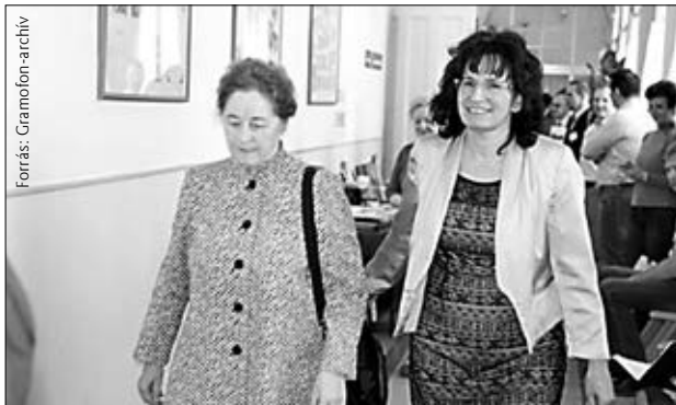
Kodály Zoltánné és Őri Csilla

Végeztem egy kis magánfelmérést nem-zenész ismerőseim körében azzal a kérdéssel, hogy kinek mi jut eszébe Kodályról, akár a mindennapok információs szintjén, akár a zeneszerző munkásságáról, akár saját iskolai múltjából. A válaszok közhelyszerűen kiszámíthatóak voltak: az első, ami eszükbe jutott, a szolmizálás... (nem tudták, nem szerették). Kevesebben emlegették a kottaolvasást... (nem tudták, nem szerették). A zeneszerző Kodályról csak segítő kérdések hatására sikerült valamit kicsikarnom: Kállai kettős, Hány János (Intermezzo), Esti dal. A népdallal kapcsolatban volt egy kis életkori szórás: aki a rendszerváltás után járt iskolába, inkább vegyes érzelmekről számolt be (nem tudtak mit kezdeni vele, „poros”). Amikor azonban a saját egykori iskolai kórusokról – ami véleményem szerint a Kodály-konceptió alfája és omegája – kérdezősködtem, elfátyolosodtak a tekintetek, belelkedtek a válaszok: a kóruséneklés a legtöbbjüknek maradandó, életre szóló élményt jelentett, egyben a zene tiszteletét, szeretetét.