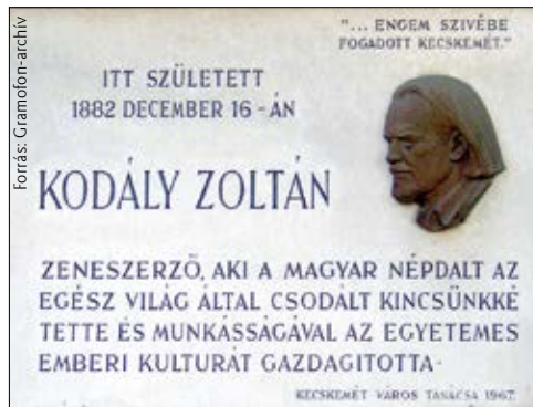
Emléktábla Kodály Zoltán kecskeméti szülőházának falán