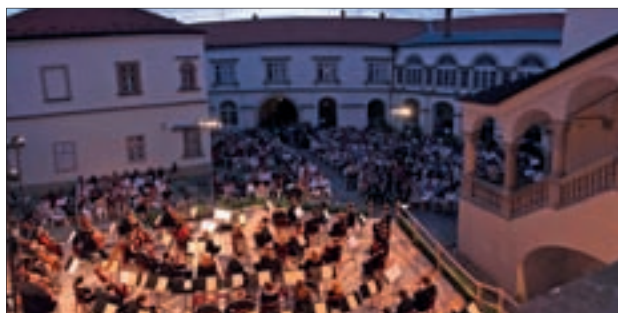
A fesztivál központi helyszíne, a sárospataki Rákóczi-vár udvara

Idén akad újdonság is jócskán, hiszen a Tokaj Kereskedőház szintén belép a támogatóik sorába. Már tavaly is ez a cég volt a hivatalos borszállítójuk, s ezen a fesztiválon, a székelyükön, Tolcsván is szerveznek rendezvényeket. A sárospataki fiatal borászok ugyancsak összefogtak, minőségi