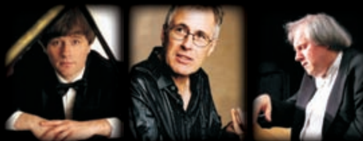
Ránki Dezső Christian Zacharias Grigorij Szokolov