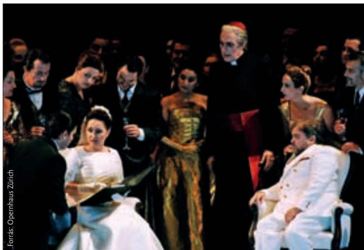
Jelenet a Lammermoori Lucia zürichi előadásából

Zürichben a 180 évvel ezelőtti (1835-ös) premiert idéző, hosszú ünneplés köszöntötte a szereplőket az előadás végén, amelyből kijutott a két főszereplő mellett a Lord