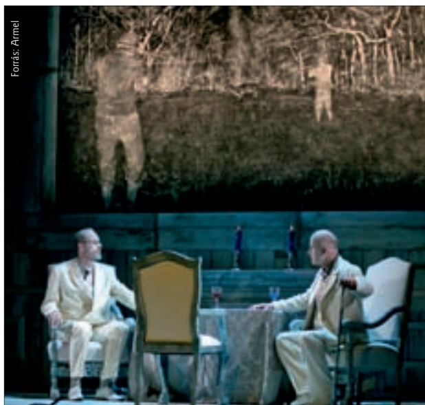
Jelenet Marco Tutino: A gyertyák csonkig égnek című operájából, amelynek fontos közreműködője a Szegedi Szimfonikus Zenekar

S még kortárs darab is akad a kínálatban, hiszen nyár elején – immár sokadszorra – fellépnek Kalocsán, a Kékmadár Fesztiválon. „Általában templomi koncerteket szoktunk adni, ezúttal azonban nagyon komoly kortárszenei programot játszunk: Csontváry képei által ihletett, mai magyar zeneműveket tűzünk műsorra; a megszólaló hat kompozíció közül háromnak az ősbemutatója áprilisban volt.”