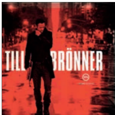
TILL BRÖNNER: TILL BRÖNNER