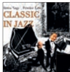
NAGY JÁNOS/FRANKIE LATO: CLASSIC IN JAZZ NAGY JÁNOS: IN LONDON