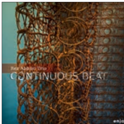
REZ ABBASI: CONTINUOUS BEAT