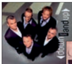
DJABE: DOWN AND UP SLICES OF LIVE