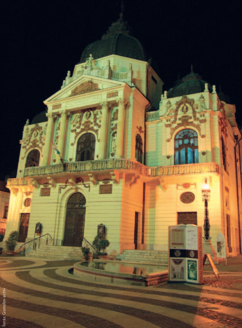
A színház alapítványa az október 8-i gálaesten mutatkozik be a közönségnek

hogy ne teljes szereptudással hozzuk a darabot az első próbára. Egy év, kettő, öt – nem tudom mennyi, de ugyanezt szeretném elérni.