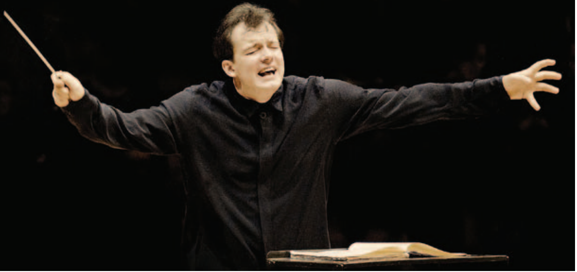
Andris Nelsons: egy neves mentor támogatása döntő lehet

Tény, hogy a karmestercsodákra sokszor nagyobb médiafigyelem terelődik, mint egy jó színvonalú hétköznapi koncertre, és miközben több jegyet lehet eladni rájuk, kevesebbe kerülnek, mint egy karrierjének közepén járó rutindirigens. Ezek pedig egy pénzszegény világban érvek lehetnek. Vannak azonban, akik mást is felhozhatnak az ifjak mellett. Például, hogy az interpretációk a tradicionális repertoárban uniformizálódnak, kevés az egyéni megközelítés, a művészi rizikóvállalás. És e vonatkozásban is frissességet hozhatnak a fiatalok, persze csak azok, akik mernek új színeket, új dinamikát követelni.