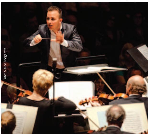
Yannick Nézet-Séguin 2012-től a Philadelphia Orchestra zeneigazgatója

A most színre lépő dirigensek közül a francia-kanadai Yannick Nézet-Séguin birtokolja majd a legpatinásabb pozíciót, 2012-ben ugyanis átveszi a „nagy ötök” egyikének, az amerikai Philadelphia Orchestrának az irányítását. Ezzel olyan karmester óriások nyomdokába lép, mint Leopold Stokowski, Ormándy Jenő, Riccardo Muti, Wolfgang Sawallisch és Christoph Eschenbach. Egyik közelmúltbeli philadelphiai koncertjéről máris az elragadtatás hangján írtak: „elbűvölő volt a jelenléte a pódiumon, palcája időnként kalligrafikus mozgást mutatott, máskor meg olyan volt, mint egy sebészi eszköz, miközben szabad kezével szinte markolta a zenét.” ■