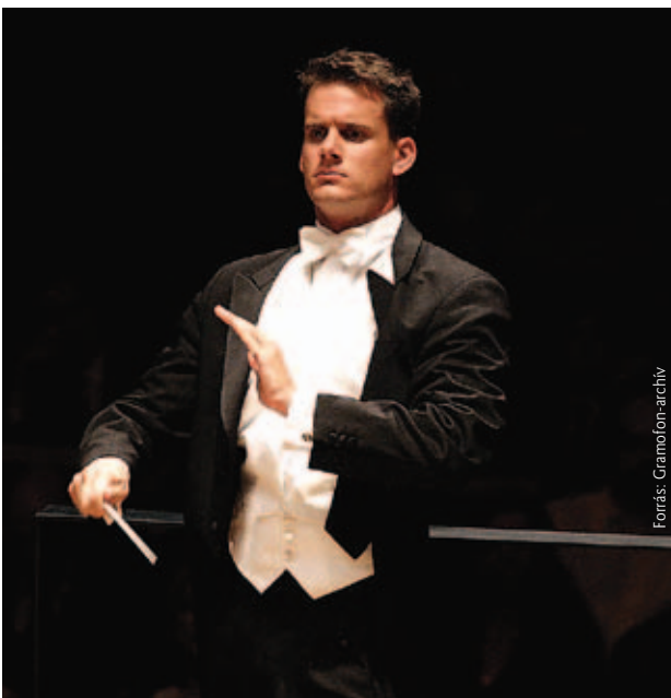
Philippe Jordan édesapja mellől indult a pályán

Philippe Jordan; két brit, a harminchat esztendő Daniel Harding és a huszonhét esztendő Robin Ticciati, illetve egy harmincnégy éves, kínai-amerikai hölgy, Xian Zhang tudta befészkelni magát. Régen korábban kiugrottak az őstehetségek. Mahler már huszonnyolc évesen a pesti Opera művészeti igazgatója volt, Toscaninit harmincegy éves korára a milánói Scala zeneigazgatójának nevezték ki, Furtwängler harmincas éveiben pompás zenekarokat irányított Berlintonól Lipcséig, Karajan pedig huszonkilenc évesen debütált a bécsi Staatsoperben, mégis Mehta a csúcstartó, aki – igaz, némi szerencsével – huszonhat évesen a Los Angeles-i Filharmonikusok zeneigazgatója lehetett.