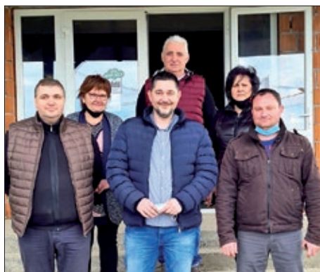
Iz Martinaca u Srednje Mokrice