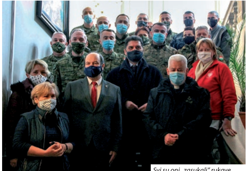
Svi su oni „zasukali“ rukave