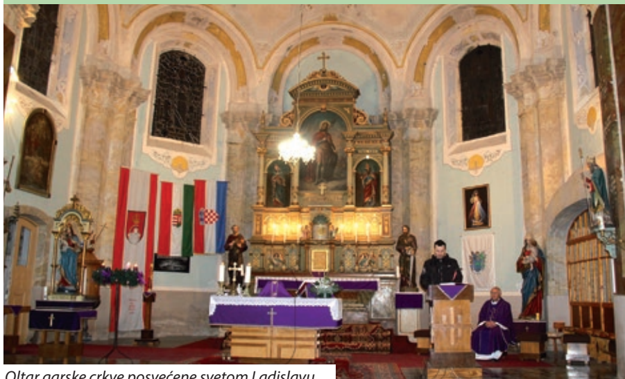
Oltar garske crkve posvećene svetom Ladislavu

Nakon više tjedana, 19. prosinca u Gari je ponovo služena misa, kojom su proslavljene Materice i Oci, blagdani bunjevačkih majki i očeva koji se slave treće i četvrte nedjelje došašća. Pridržavajući se epidemioloških uputa, u župnoj crkvi okupilo se dvadesetak bunjevačkih Hrvata.