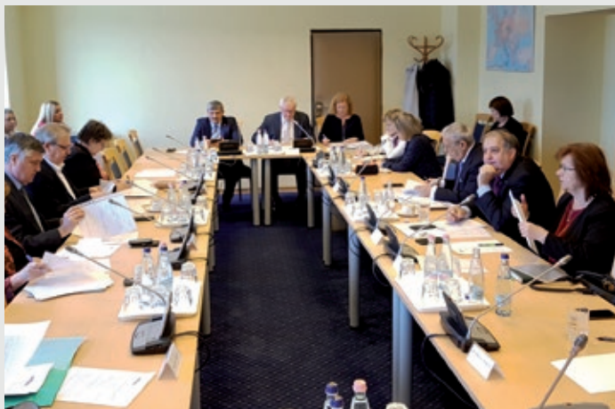
Glasnogovornik Solga inicijativu je uputio i članovima Odbora za narodnosti

Kao predstavnik Hrvata u Mađarskom Parlamentu, pridružio se inicijativi Vlade Republike Hrvatske, Hrvatske državne samouprave i šomođskih parlamentarnih zastupnika pa je na račune spomenutih uputio osobnu novčanu donaciju ukupnog iznosa od 500 000 ft, te osigurao prijevoz materijalne pomoći iz Martina i okolice u Srednje Mokrice, pored Petrinje. Ovim putem zahvaljuje se Vladi Mađarske, članovima parlamentarnog Odbora za narodnosti i svima onima koji su do sada pružili pomoć Hrvatskoj, te ih potiče na daljnju potporu stradalim krajevima.