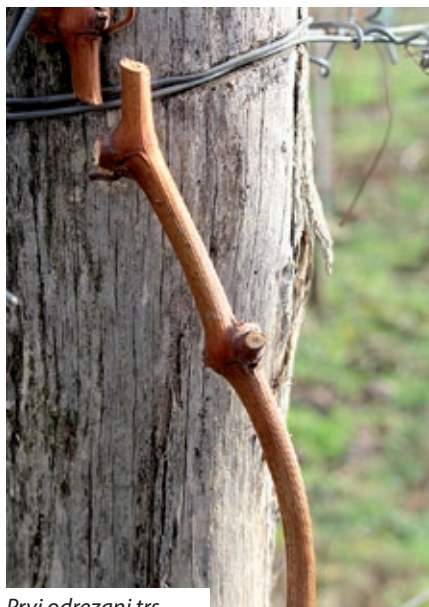
Prvi odrezani trs