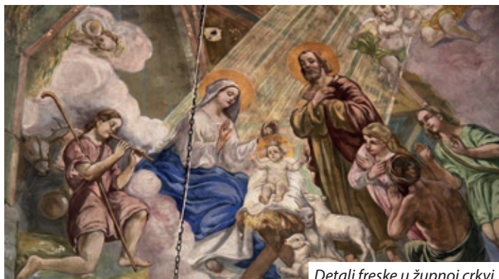
Detalj freske u župnoj crkvi

po 250 tisuća, te Garske hrvatske samouprave od 400 tisuća forinti. Tom prigodom Hrvatska samouprava Gare predala je božićni dar garskoj župi, uručivši župniku uređaj za čišćenje crkve. Po završetku mise, vlč. Tibor Szűcs posvetio je obnovljene bunjevačke vitraje, a Hrvatska samouprava skromnim je darovima čestitala svim nazočnim vjernicima Božić i Novu godinu. S.B.