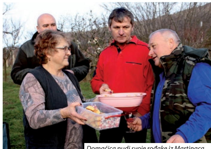
Domaćica nudi svoje rođake iz Martinaca