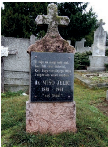
Jelićev grob u bajskom groblju svetog Roka