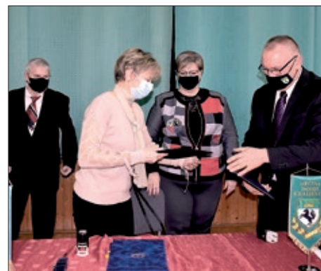
Zajedno pomažu žrtvama potresa