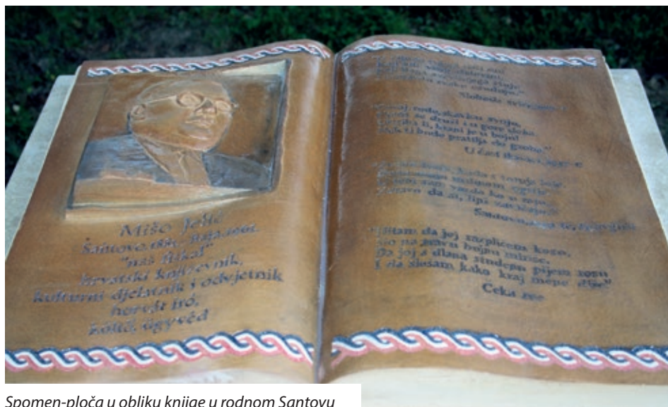
Spomen-ploča u obliku knjige u rodnom Santovu

ljače 1961. godine preminuo. Pokopan je na bajscome groblju svetog Roka, gdje počiva pokraj svoje sestre Đule.