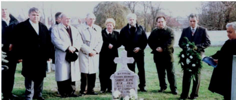
Na postavljanju spomen-ploče na njegovom grobu 2001. godine

Santovu, 1940., 15. avgusta/, „Hitam, da joj razplićem kosu, Što na travu bujnu miriše, Da joj s dlana studenu pijem rosu/ da slušam kako kraj mene diše.”/Čeka me. O njegovom životu i radu objavljen je i napis na mađarskom jeziku. U ožujskom broju časopisa Mađarske državne javnobilježničke komore „Notarius Hungaricus” iz 2017. godine, budimpeštanski javni bilježnik dr. Gábor Rokolya pisao je o njegovom životu i radu, pod nadnaslovom „Jedan javni bilježnik, jedan slučaj (Egy közjegyző egy eset)”, te naslovom „Javni bilježnik Mihály Jelić, iliti tužan život hrvatskog pjesnika Miše Jelića (Jelić Mihály közjegyző, avagy Mišo Jelić horvát költő szomorú élete)”. Navodeći pojedinosti o nesretnoj sudbini dr. Miše Jelića, autor uz ostalo zaključuje: „Iz arhivskih dokumenata se vidi, kako je pesnica komunističke partije” i ovoga puta udarila na čovjeka koji je u svom neposrednom okruženju uživao ugled i istaknuo se svojim društvenim angažmanom”. Završno je naveo i to kako su 2000. godine objavljene njegove pjesme i proza, a spomen na njega čuvaju spomen-ploče na njegovom grobu u bajscom groblju svetog Roka, kao i u rodnom Santovu. S.B.