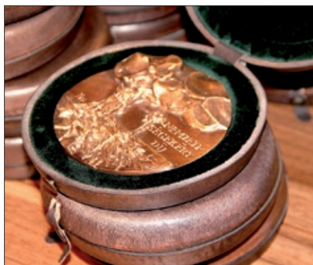
Nagrada za narodnosti