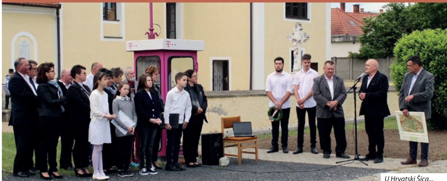
U Hrvatski Šica...

Mnogim u našem orsagu morebit i stranjsko zvuči, znamda bi moglo biti i vječno odsudjeno na mučanje, kako i na koji način su se Gradišćanski Hrvati spomenuli na svoj dio turobne povijesti, 4. junija, na danu stote obljetnice potpisanja Trianonskoga mirovnoga ugovora i na Danu nacionalnoga zajedništva. Jer mnogim je i za stovimi ljeti manje poznato da je ta dekret ov narod rascipao u tri države, a u Pinčenoj dolini je Nardu, Dolnji i Gornji Četar, Ugarski i Nimški Keresteš, Hrvatske Šice, Pornovu i Petrovo Selo, kot polag Kisega dodatno još i Plajgor, s potezom pera odredio k Austriji. Šopron, Civitas Fidelissima s okolnimi seli glasovao je na referendumu za ostanak u Ugarskoj, a vjerna naselja/Communitas Fidelissima većmisečnom borbom su izvojevala da 1923. ljeta, ponovo se vraćaju u krilo Ugarske.