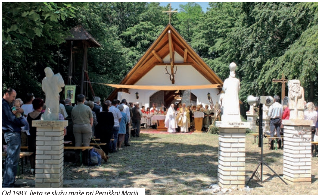
Od 1983. ljeta se služu maše pri Peruškoj Mariji