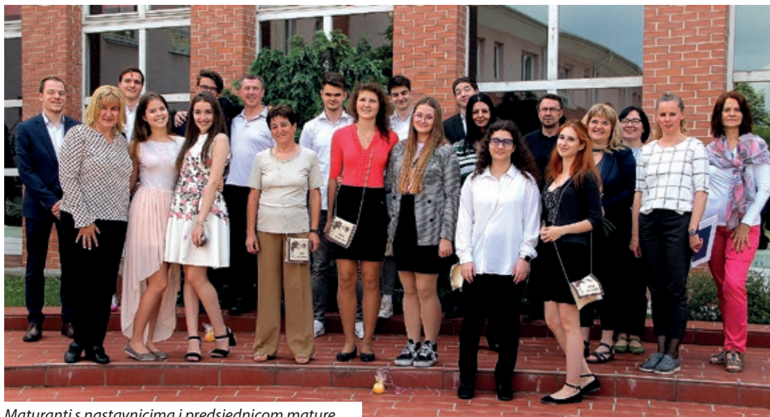
Maturanti s nastavnicima i predsjednicom mature

joj je jako žao što se ovogodišnja državna matura razlikuje od prijašnjih te nije imala prilike bolje upoznati maturante i slušati njihova usmena izlaganja. Ipak, neki su iskoristili mogućnost i lanjske godine položili prijevremenu državnu maturu iz pojedinih predmeta, pa je stekla vrlo pozitivan dojam o maturantima. Uputivši čestitke naglasila je kako je na ovogodišnjoj državnoj maturi bilo puno lijepih rezultata, a na kraju je svima zaželjela puno sreće u životu.