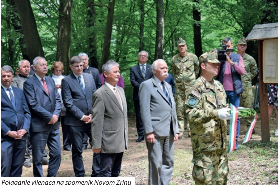
Polaganje vijenaca na spomenik Novom Zrinu

Nakon popuštanja mjera i suzbijanja zaraze 10. lipnja održana je prethodno otkazana svečana primopredaja i posveta rekonstruiranog zdenca na području nekadašnje utvrde Novi Zrin.