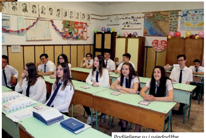
Podijeljene su i svjedodžbe