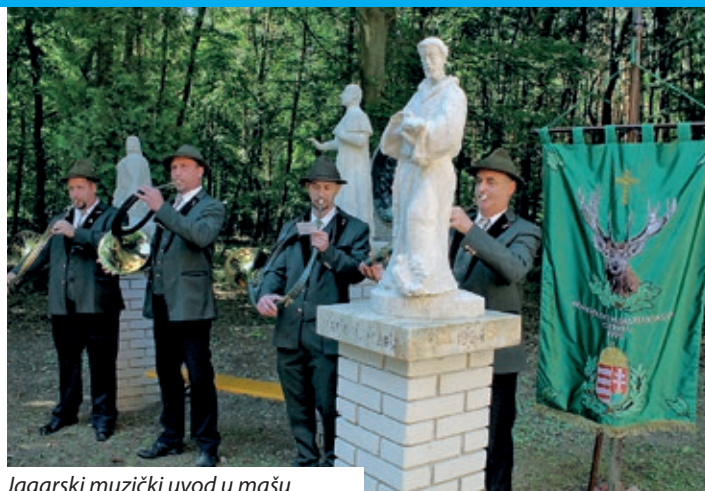
Jagarski muzički uvod u mašu