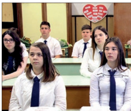
Oproštajna svečanost u Santovu