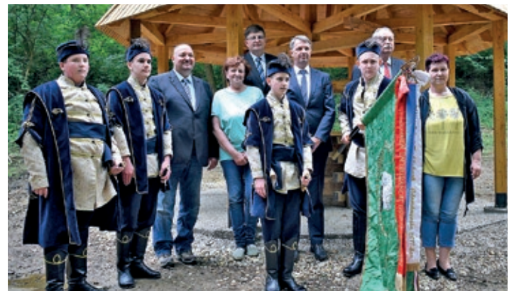
„Zrinski kadeti“ u društvu zamjenika ministra obrane Szilárda Németha i drugih dužnosnika ispred rekonstruiranog zdenca

Zdenac je rekonstruiran u povodu 400. obljetnice rođenja Nikole VII. Zrinskog, koji je 1661. godine radi obrane od turskih napada dao podignuti utvrdu na tromeđi Belezne, Tiloša i Kerestura. László Vándor, umirovljeni ravnatelj Muzeja Zalske županije u svom prigodnom govoru osvrnuo se na povijest utvrde i rezultate arheoloških istraživanja prilikom otkrivanja zdenca. Visoki dužnosnici, parlamentarni državni tajnik i zamjenik ministra obrane Szilárd Németh, državni tajnik Ministarstva inovacije i tehnologije Péter Cseresnyés, parlamentarni zastupnik Šomođske županije László Szászfalvi, brigadni general Mađarske vojske dr. Gábor Böröndi, general bojnik Nacionalnog sveučilišta javne službe prof. dr. József