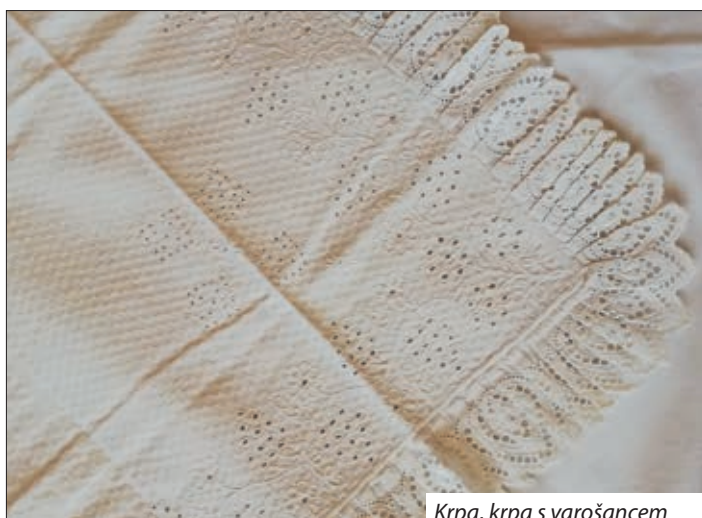
Krpa, krpa s varošancem

Kapica za mlade bila je malo najasprana ili svilom otkana. Za stare je crnim, plavim pamukom tkano.