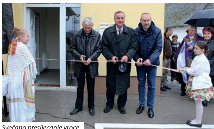
Svečano presijecanje vrpce