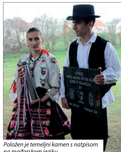
Položen je temeljni kamen s natpisom na mađarskom jeziku.