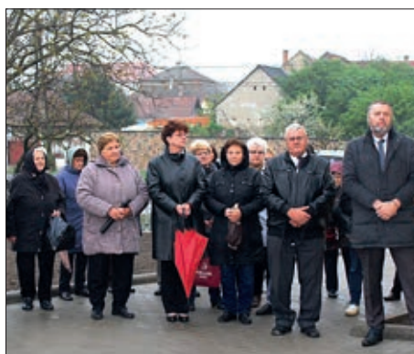
Novosti iz Santova