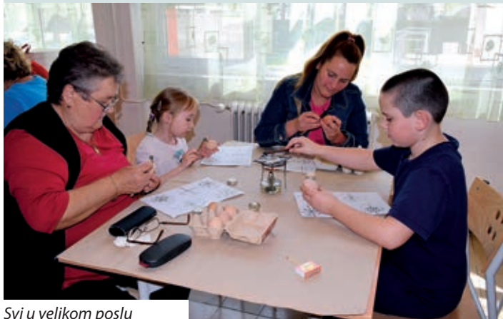
Svi u velikom poslu

Hrvatska samouprava Zalske županije poradi njegovanja pomurskih običaja, pisanja pisanica objavila je poziv za obiteljsko natjecanje u izradbi izvornih pomurskih pisanica pod naslovom „Najljepša pomurska pisanica“. Prijavilo se 17 parova iz Boršfe, Letinje i Kerestura koji su 15. travnja u blagovaonici keresturske Osnovne škole „Nikola Zrinski“ obična jaja pretvorili u prekrasne crvene pisanice.