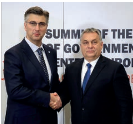
Andrej Plenković i Viktor Orbán

U sklopu 9. Poslovnog foruma „16 + 1“ u Dubrovniku su održani brojni dvostrani poslovni sastanci (B2B) gospodarstvenika iz