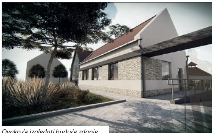
Ovako će izgledati buduće zdanje.

Kako smo već pisali 12. travnja 2018. godine u Hrvatskome glasniku broj 15, Ministarstvo ljudskih resursa iz fonda ministra Zoltána Balogha i narodnosnog fonda tog Ministarstva dodijelilo je 80 milijuna forinta potpore za gradnju Hrvatsko-mađarskoga kulturnog doma u Semelju, o čemu su dokument tada potpisali državni tajnici Miklós Soltész i Péter Hoppál sa semeljskim načelnikom Józsefom Kumlijem. Prošlo je godinu dana od toga čina i prišlo se polaganju temeljenog kamena budućega zdanja.