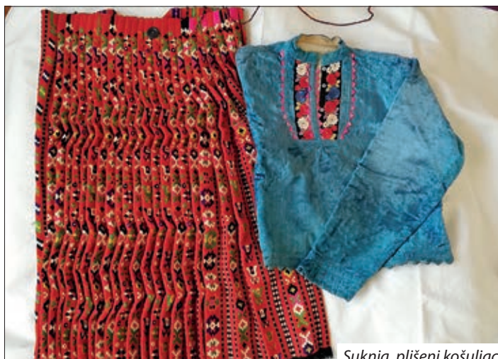
Suknja, plišeni košuljac

1. U postu ni djevojke ni mlade žene nisu se jako opravljale. Obukle su malo naprste vunenu suknju, to su mali redovi (tj. uski), motivi (esovi, sabljice, jabuke). Tako isti stil i pregača i obojak (naprste je kelim tehnika).