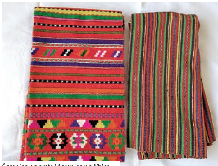
Šarenica na prste i šarenica na šibice