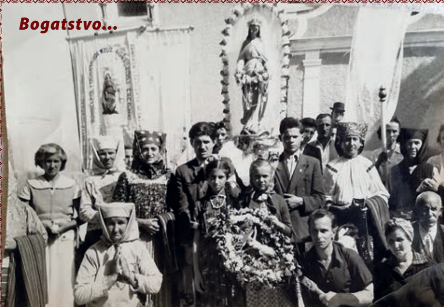
U Semartinu pred tamošnjom crkvom i u hrvatskoj narodnoj nošnji