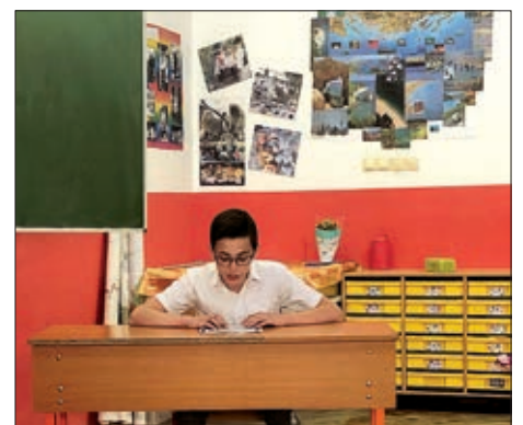
Natjecanje u lijepom čitanju