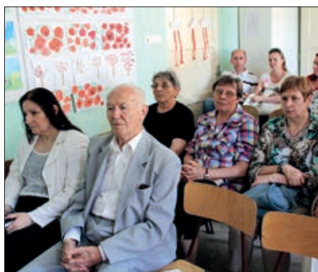
Skupština Saveza Hrvata