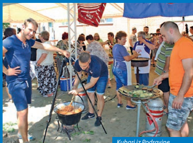
Kuhari iz Podravine

U okviru cjelodnevnoga programa Dana narodnih kultura u Mađarskoj, priredbu je prilozima iz Baje s Kulturnog i gastronomskog dana Hrvata popratio i javni medijski servis putem televizijskog kanala Duna TV. Predstavljena je Bunjevačka zavičajna kuća i župna crkva svetog Antuna Padovanskog, nekadašnja franjevačka crkva, što je popraćeno višekratnim javljanjem uživo s Kulturno-gastronomskog dana Hrvata u Mađarskoj.