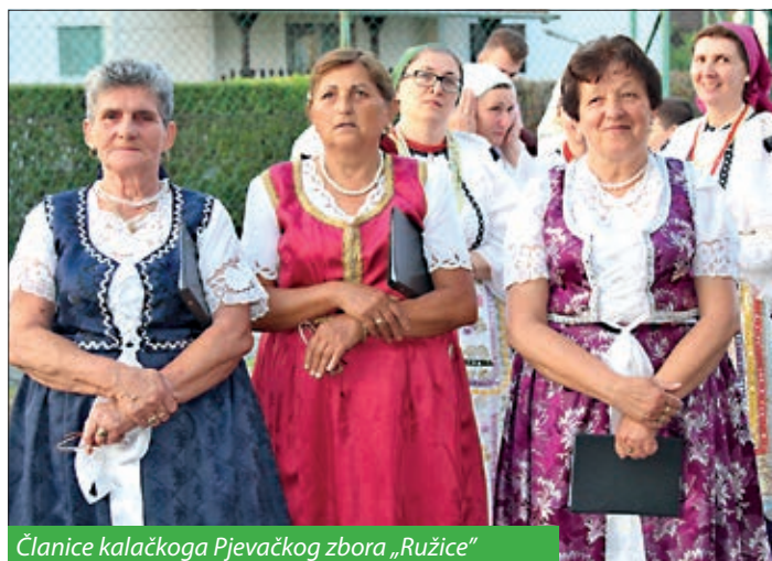
Članice kalačkoga Pjevačkog zbora „Ružice“

U suorganizaciji Seoske i Hrvatske samouprave, u bačkome hrvatskom naselju Dušnoku 19. – 20. svibnja organizirani su dva-deset i šesti Racki Duhovi ili, kako Dušnočani vele, Racke Pinkužde. Dan uoči Duhova, u subotu, 19. svibnja, Hrvatska samouprava uz misu i prigodni kulturni program organizirala je Dan Hrvata koji je uz domaće skupine okupio i gostujuća društva iz Gare, Bačina, Vršende, Martinaca i Santova.