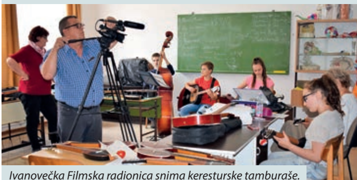
Ivanovečka Filmska radionica snima keresturske tamburaše.

Europska grupacija za teritorijalnu suradnju s ograničenom odgovornošću Regija Mura, 30. svibnja u svome sjedištu u Fedakovoj kuriji održala je svoju godišnju skupštinu na kojoj su prihvaćena izvješća o djelatnosti i radu poslovne godine 2017., te su predstavljeni planovi za 2018. Na zasjedanju posebno je naglašen vodeni, turistički projekt „Dvije rijeke, jedan cilj“ koji će se ostvariti do kraja godine sufinanciranjem Europske unije. U projekt je uključeno pet naselja iz Pomurja i tri općine iz Međimurja. Cilj je projekta razvoj vodenog turizma, proširenje mogućnosti plovidbe i pristajanja na rijekama Mure i Drave. Jedna od važnih točaka zasjedanja bilo je proširenje broja članova. Kao novi članovi uključili su se: gradovi Ludbreg i Prelog, Općina Domašinec i Međimurska županija, te Benesedžodž (Bánokszentgyörgy), Kralevec (Kerkaszentkirály), Tulmač (Kistolmács), Semenince (Muraszemenye), Ratkovce (Murarátka) i Sajka (Zajk). Time su članicom postala sva mjesta s jedne i druge strane rijeke Mure. Načelnici su usuglasili zajedničke interese poslovne suradnje te pripreme na zajedničke projekte u natjecanju HUIR Interreg V-A, prioriteta „B“ Light, koji će biti raspisan poradi razvoja malih i srednjih poduzetnika.