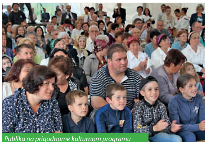
Publika na prigodnome kulturnom programu

Prijepodne je u Dankóovoj ulici svečano predano novo nogometno igralište s umjetnim travnjakom i rasvjetom. Tom su prigodom domaćini odigrali prijateljsku malonogometnu utakmicu s momčadi iz susjednog Bačina. U rekreacijskom parku na Bari u podne je počeo gastronomski susret i pripremanje tradicijskih jela i drugih kulinarskih specijaliteta.