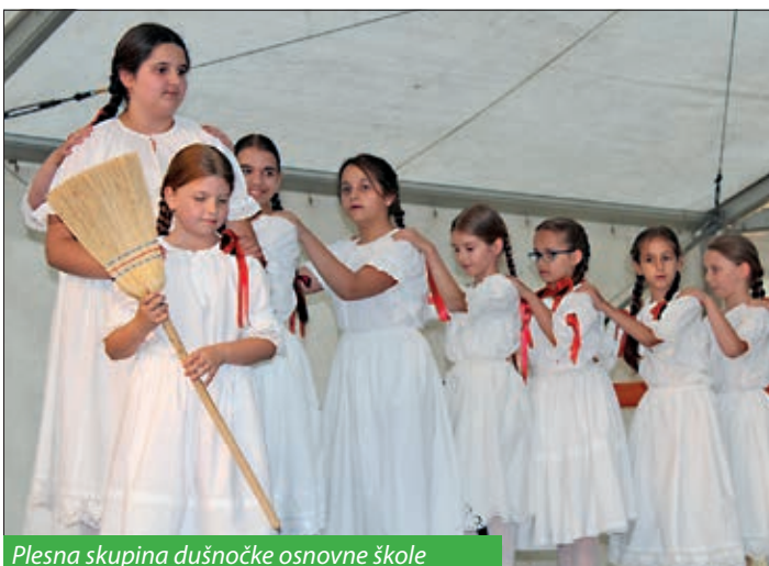
Plesna skupina dušnočke osnovne škole