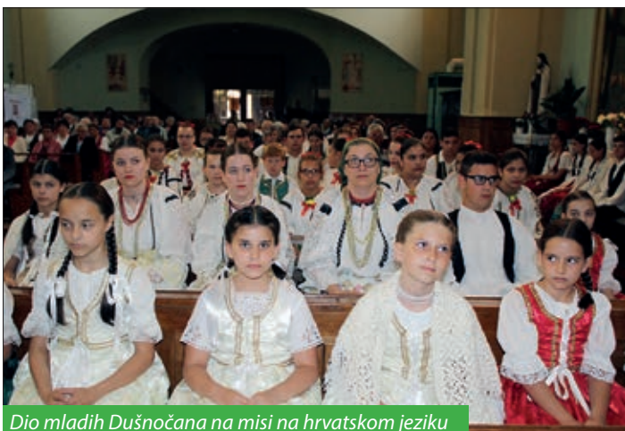
Dio mladih Dušnočana na misi na hrvatskom jeziku