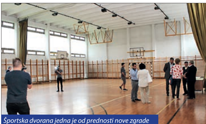
Športska dvorana jedna je od prednosti nove zgrade