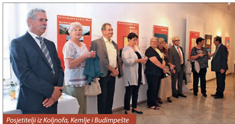
Posjetitelji iz Koljnofa, Kemlje i Budimpešte