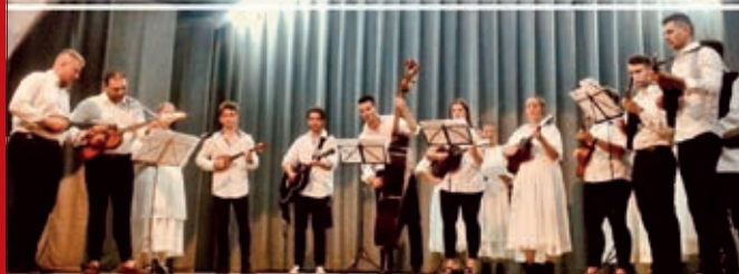
Koljnofsko hrvatsko društvo | Društvo Hrvati-Horvátok | Mladi Koljnofci Hrvatska samouprava Koljnof | Općina Koljnof | Matrica hrvatska Sopron | Čakavska katedra Sopron