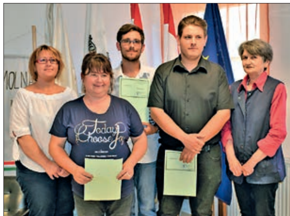
Novi sastav mlinaračke Hrvatske samouprave u društvu bilježnika i predsjednice Izbornog povjerenstva

Na osnivačkoj su sjednici zastupnici prihvatili proračun za tekuću godinu, te programe u tekućoj godini, prema planu Samouprava će u suradnji sa Seoskom samoupravom i civilnim udrugama organizirati Dan naselja. Možda će ta zajednička priredba izgladiti prije nastalu napetost između dviju samouprava u Mlinarcima. beta