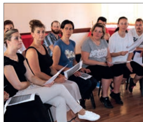
Prvi seminar folkloru