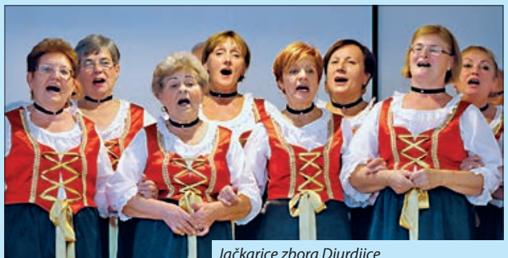
Jačkarice zbora Djurdjice