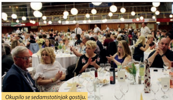
Okupilo se sedamstotinjak gostiju.