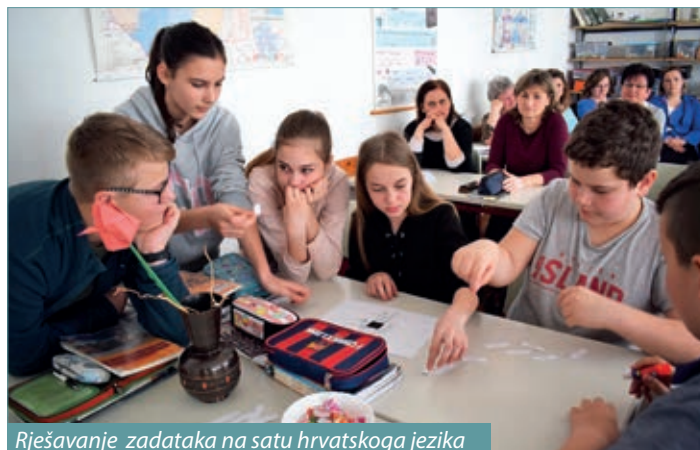
Rješavanje zadataka na satu hrvatskoga jezika

Bazične obrazovne ustanove poradi jačanja uspješnosti pedagoškog rada tijekom školske godine pružaju mogućnost za održavanje stručnih radionica, organiziranju raznih natjecanja, usavršavanja. Titulu narodnosne bazične ustanove dobile su osnovne škole u Keresturu i Serdahelu, naime one odgovaraju suvremenim zahtjevima i osiguravaju uvjete za dolično podučavanje narodnosnog jezika, povijesti, narodopisa, književnosti i kulture, nude izvannastavne aktivnosti s narodnosnom tematikom i raspoložu suradnjom s ustanovama iz matične domovine. Nova titula obvezuje ustanove da tijekom školske godine organiziraju stručne programe, tako je ove godine u serdahelskoj školi održano nekoliko usavršavanja za nastavnike pomurskih hrvatskih škola, saznajemo od ravnateljice Marije Biškopić Tišler. Bilo je riječi o vjerodostojnim sredstvima u nastavi, o problemima djece s poteškoćama u razvoju, održan je sat narodopisa u