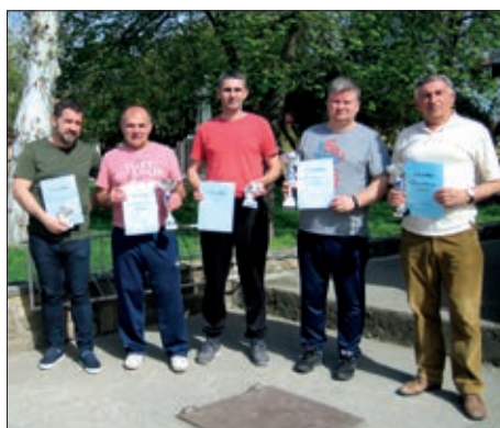
Malonogometni turnir u Bačinu