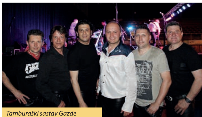
Tamburaški sastav Gazde