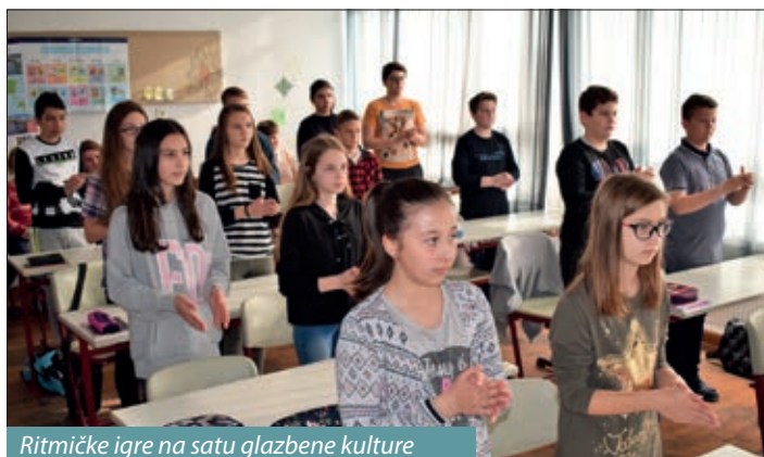
Ritmičke igre na satu glazbene kulture