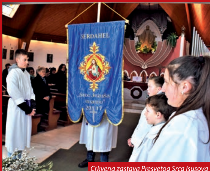
Crkvena zastava Presvetog Srca Isusova