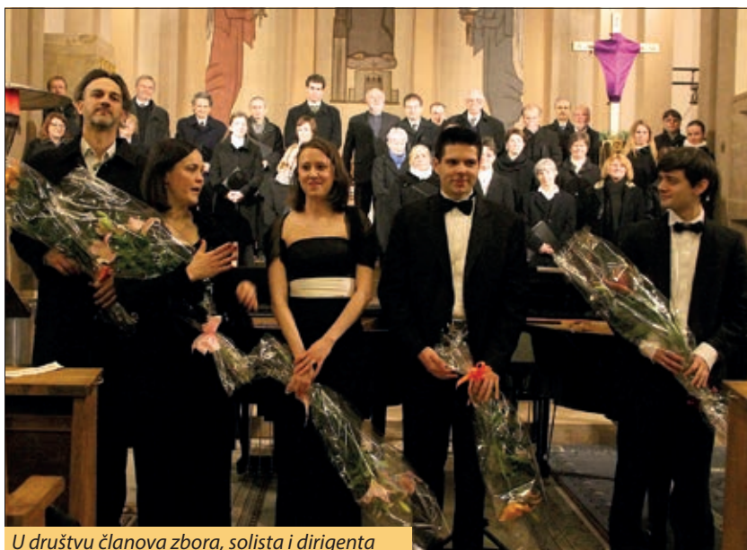
U društvu članova zbora, solista i dirigenta