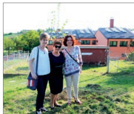
U Donjoj Zelini