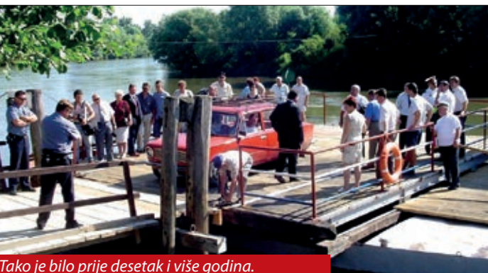
Tako je bilo prije desetak i više godina.

Oni bi se obnovili nakon uvođenja šengenskoga prostora u koji bi ušla i Republika Hrvatska. Bilo bi to slobodno kretanje jer bi se ukinuo nadzor granica za putnike, osim u izvanrednim okolnostima. Rečeno je kako se razgovaralo da bi granica funkcionirala uspostavom prometovanja riječnom skelom. Takva skela, imena Zrinski, ovdje, na desnoj obali rijeke Mure, bila je do posljednjega srpanjskog dana 2010. godine kada je promijenila vez. Toga je dana s desne obale rijeke Mure ona dotegljena na lijevu obalu odvodnog kanala HE Dubrava na Dravi. Time je ostvarena odluka