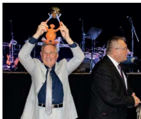
Hrvatska državna kobasijada