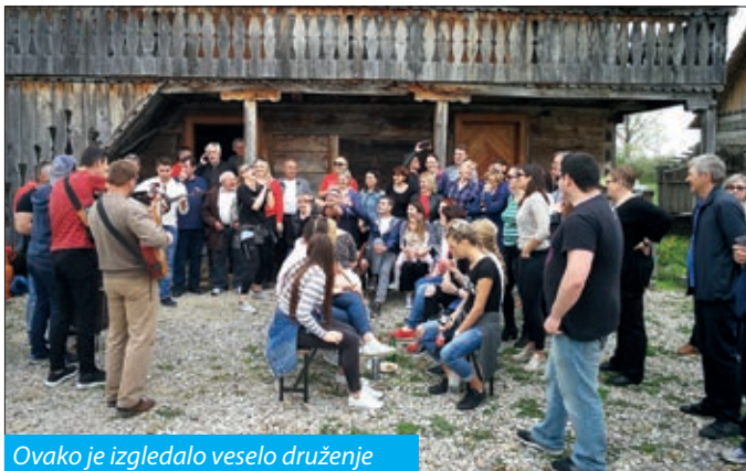
Ovako je izgledalo veselo druženje