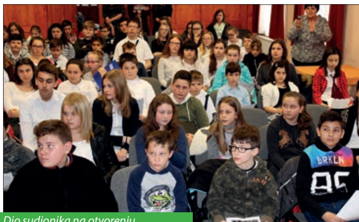
Dio sudionika na otvorenju

središtem u Bikiću – s predmetnom nastavom hrvatskoga i njemačkoga jezika.