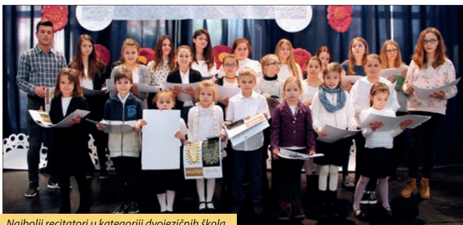
Najbolji recitatori u kategoriji dvojezičnih škola