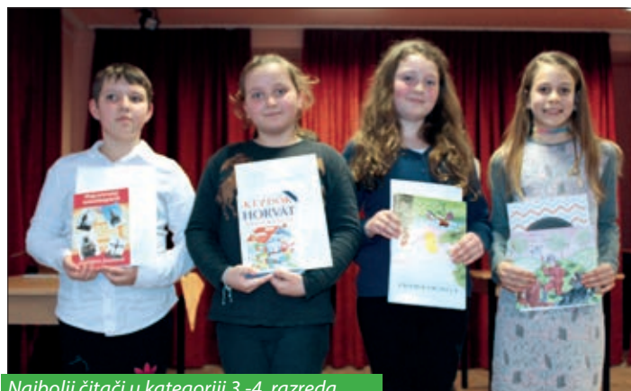
Najbolji čitači u kategoriji 3.-4. razreda