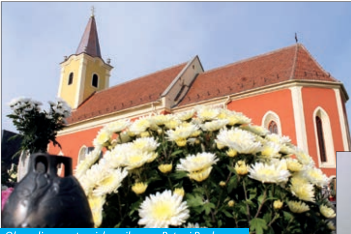
Obnovljena petroviska crikva sv. Petra i Pavla