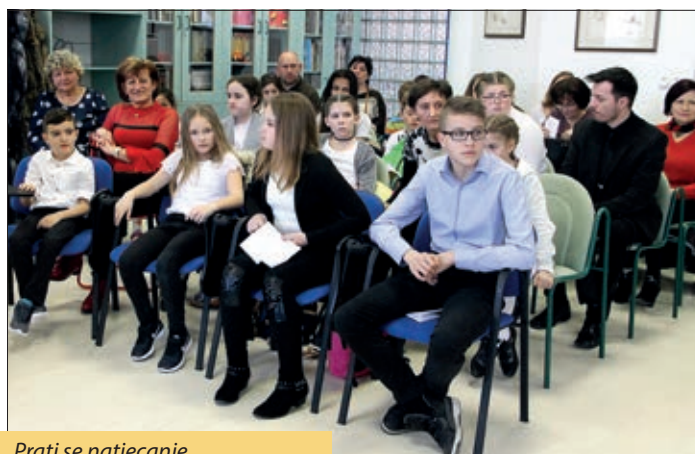
Prati se natjecanje.