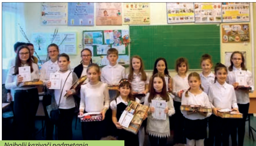
Najbolji kazivači nadmetanja