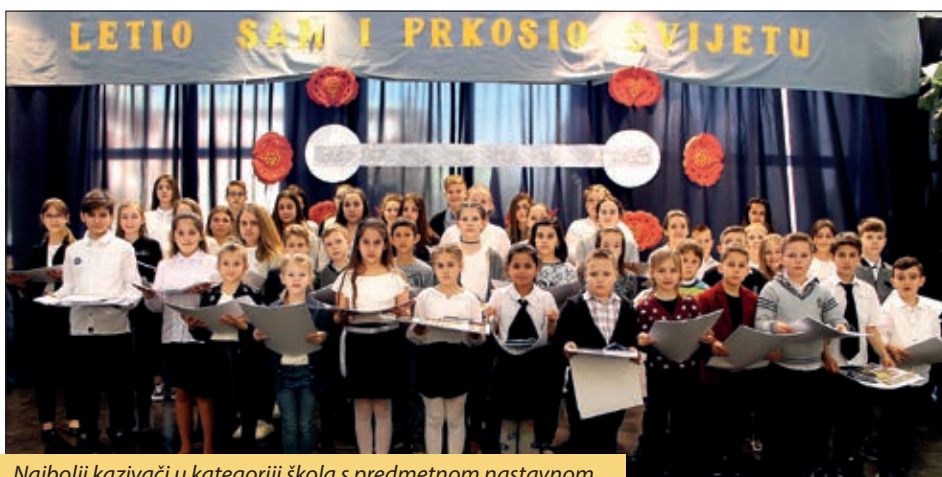
Najbolji kazivači u kategoriji škola s predmetnom nastavom