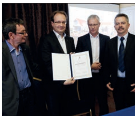
Hrvatsko-mađarski dom u Semelju 7. stranica