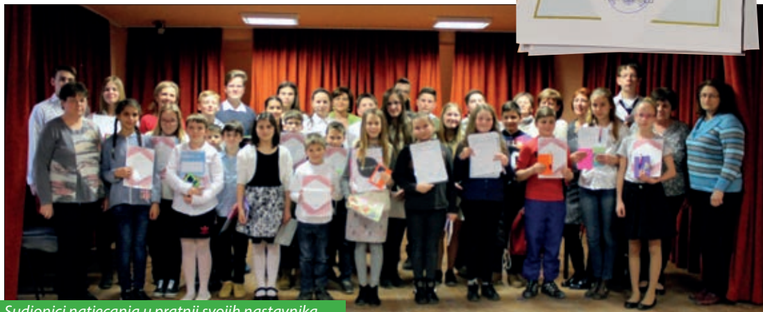
Sudionici natjecanja u pratnji svojih nastavnika

no šestu godinu zaredom. U početku je to bilo samo školsko natjecanje, a lani pozvali su i aljmaške učenike. Prvi put ove godine organizirano je pak županijsko natjecanje u lijepom čitanju na hrvatskom jeziku na kojem su uz kačmarske učenike sudjelovali i polaznici predmetne nastave hrvatskoga jezika iz Aljmaša, Bačina, Dušnoka i Fancaške osnovne škole iz Baje. Pozivu se odazvalo sveukupno 36 učenika, a prired-