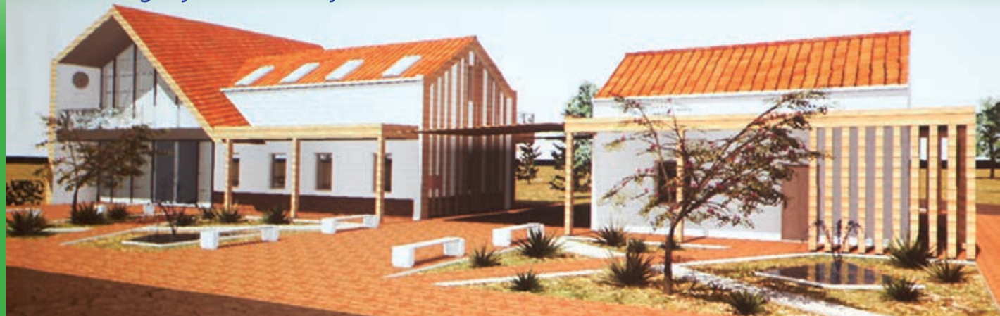
Nacrt budućega Hrvatsko-mađarskog doma kulture u Semelju

Svečano je bilo u Semelju 5. ožujka. Dom kulture napunio se Semeljcima i njihovim prijateljima iz obližnjih naselja, ali i iz prijateljskih naselja u Republici Hrvatskoj, Semeljaca i Suze. Visoki državni dužnosnici toga su dana posjetili Semelj, tako Miklós Soltész, državni tajnik Ministarstva ljudskih resursa zadužen za vjerske, narodnosne i civilne veze, te državni tajnik Ministarstva ljudskih resursa zadužen za kulturu, i Péter Hoppál, parlamentarni zastupnik izbornog okruga u kojem se nalazi Semelj.