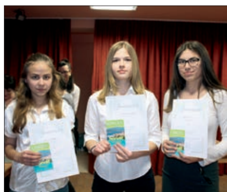
Kačmar – natjecanje u lijepom čitanju 6. stranica