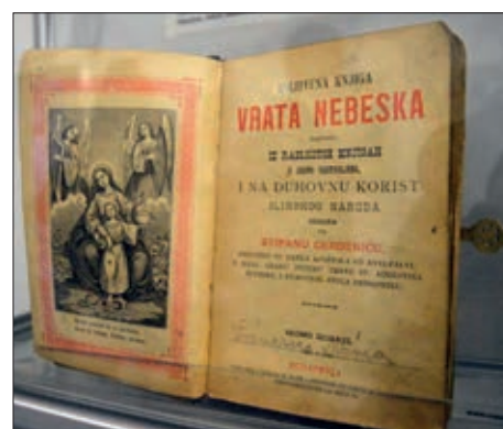
Izložba hrvatskih molitvenika 9. stranica